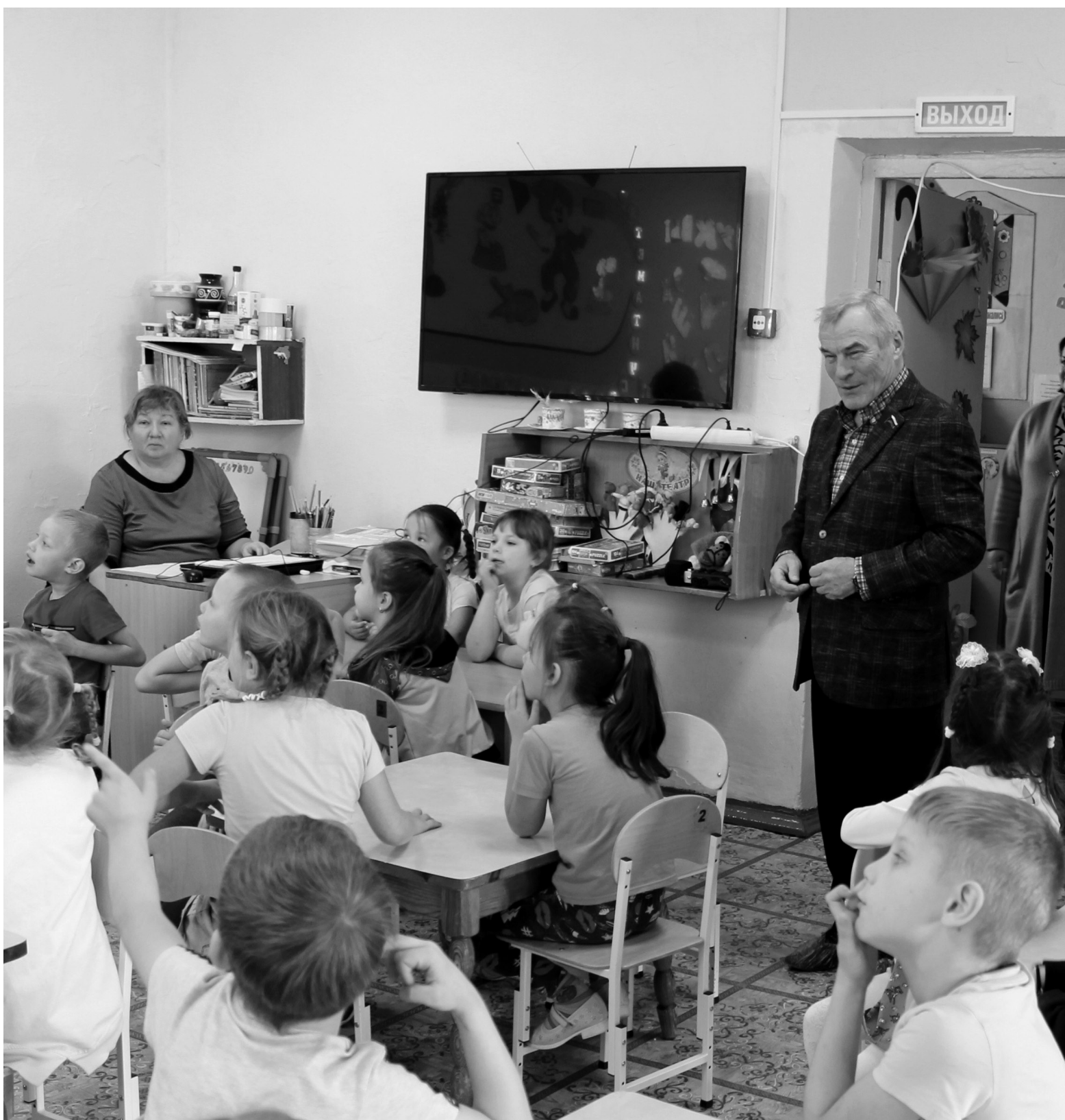
В детском саду депутат пообщался со старшими дошкольниками

ресурсы позволяют всё это делать, бюджет Тюменской области, думаю, будет ничем не ниже бюджетов прошлых лет, и поэтому уверенность в том, что ремонт будет выполнен, есть, – рассказал депутат Тюменской областной Думы. – Что касается строительства Дома культуры, то эта работа сложнее, чем капитальный