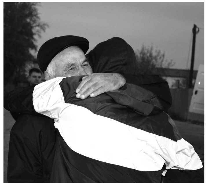
На снимках: кадры из фотоархива, посвящённого частичной мобилизации