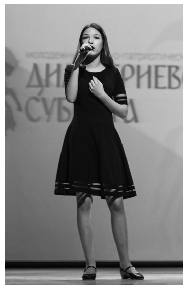
На снимках: фрагменты творческих выступлений