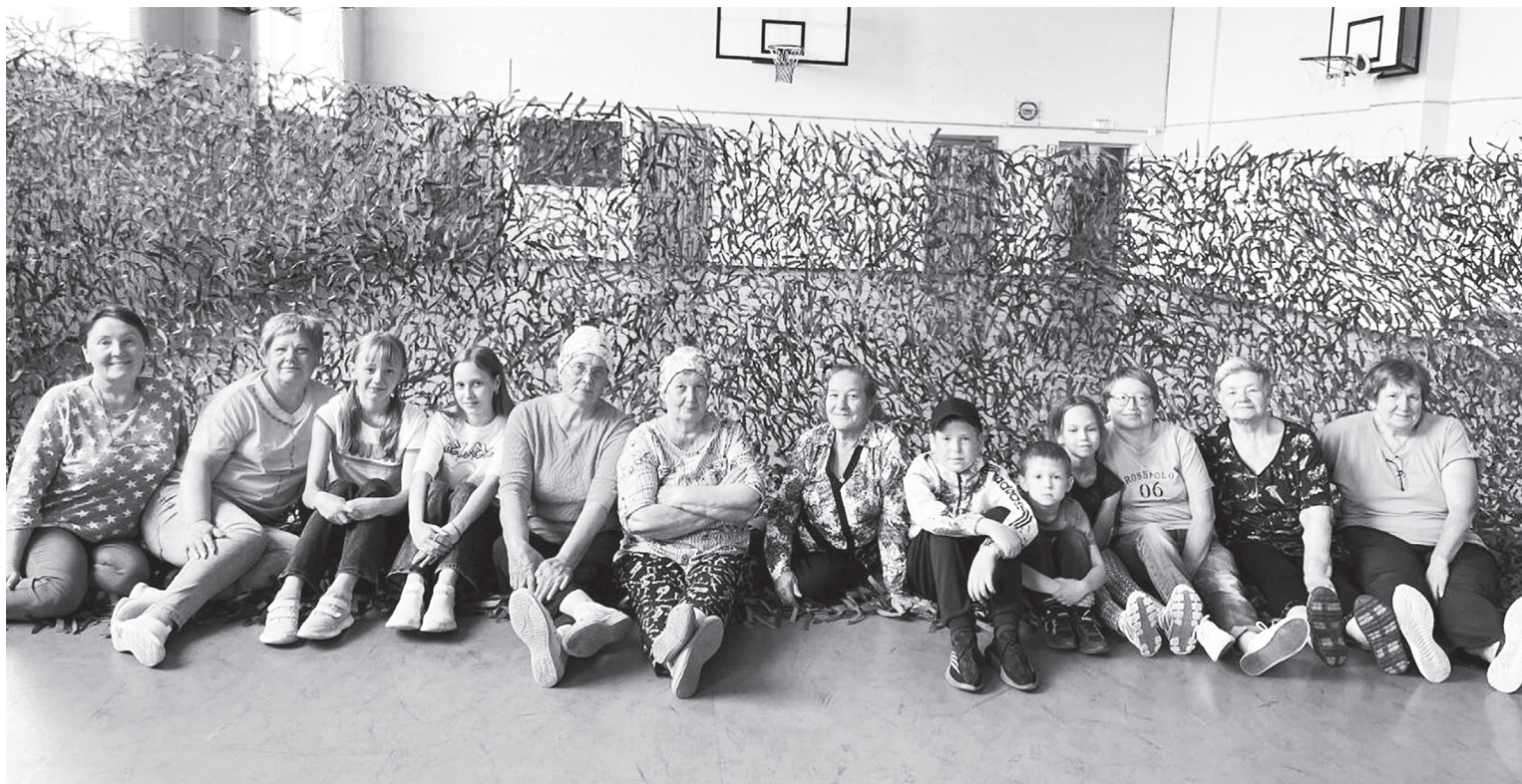
Лесновцы завершили работу