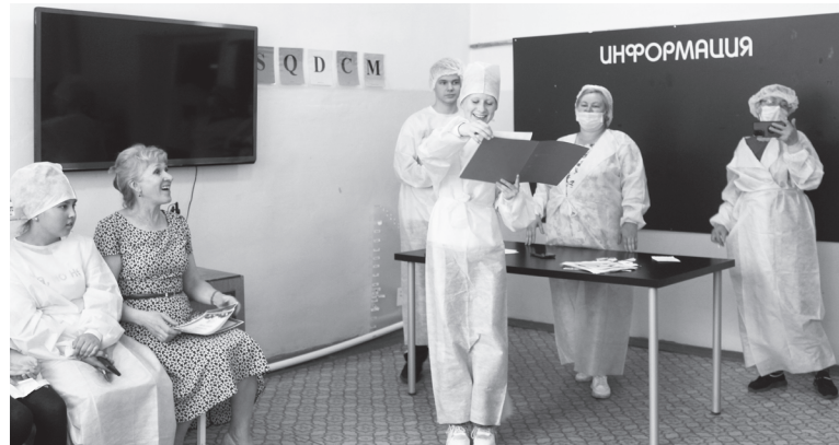
Слова благодарности от юных жителей района