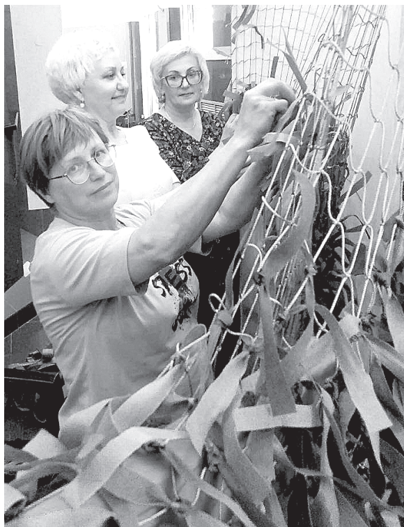
Активисты местного женсовета

Татьяна ГЕОГЕНОВА