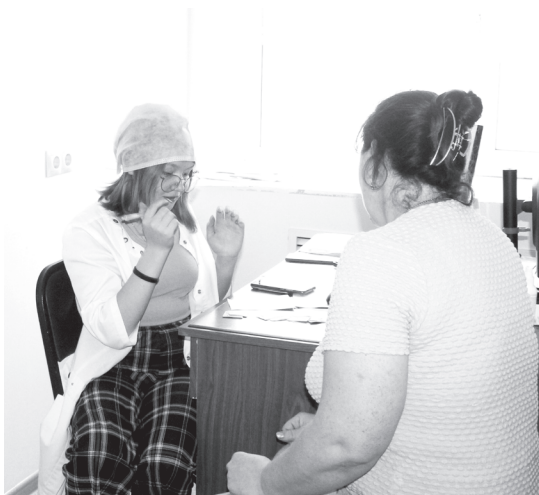
Приём ведут волонтеры-медики