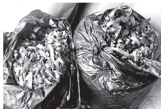
Очередная посылка доставлена в Тюмень