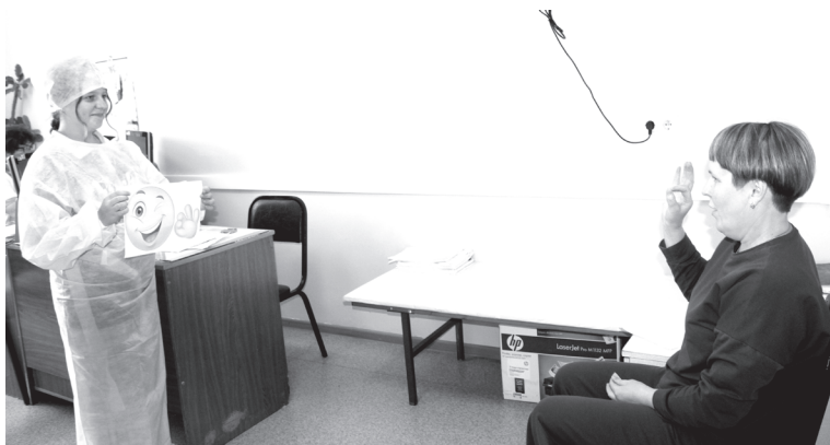
Весёлые задания предстояло выполнить пациентам