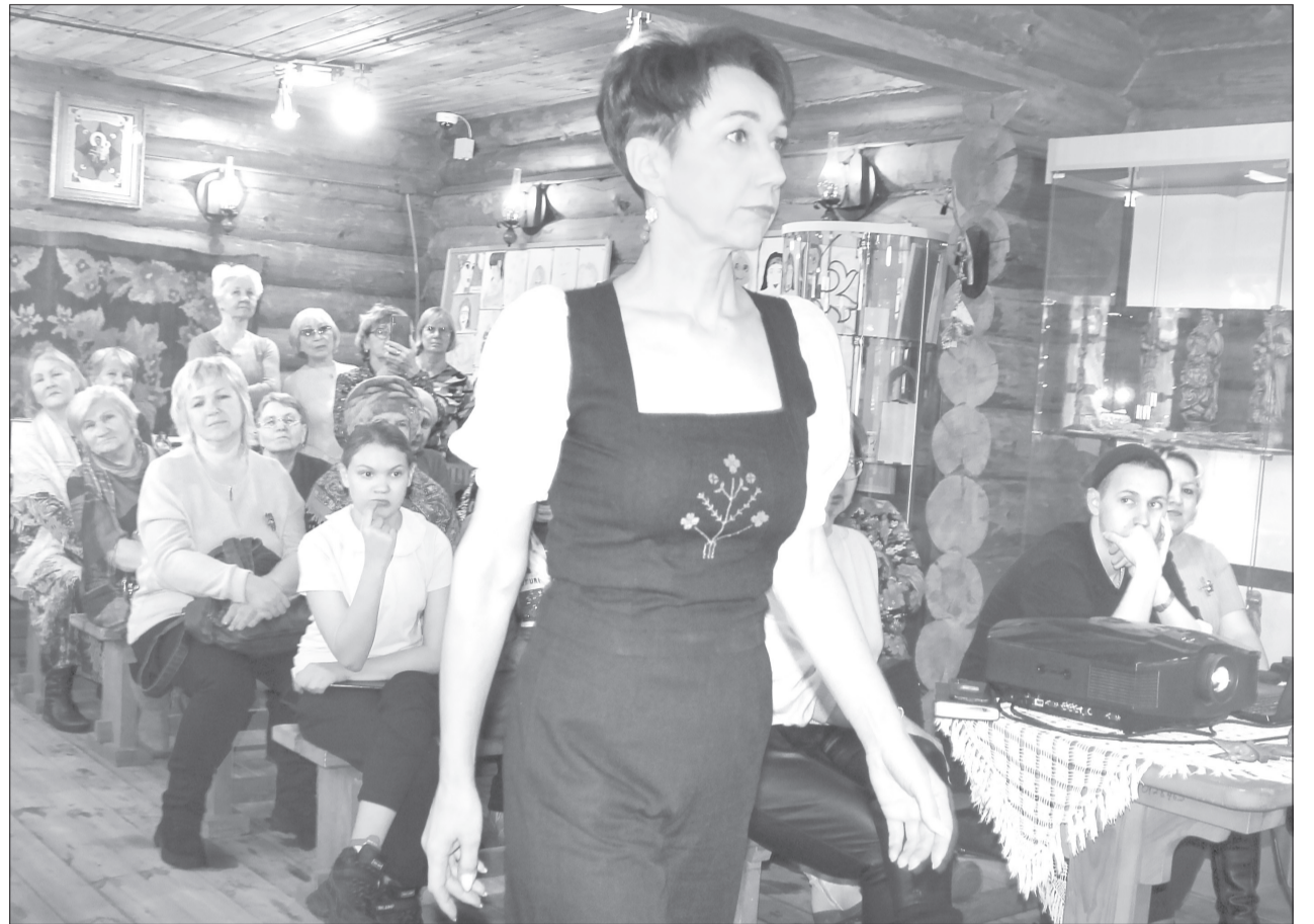
Коллекцию одежды с использованием узора Ялуторовского Притоболья показали модели театра моды «Арт Подиум». Каждый мотив несёт в себе определённый смысл и значение

На такие акции традиционно приглашают достигших 14-летия ребят, которые отличились успехами в учёбе и активной общественной деятельности. В прошлом году в День Конституции паспорта в торжественной обстановке получили десять сельских подростков.