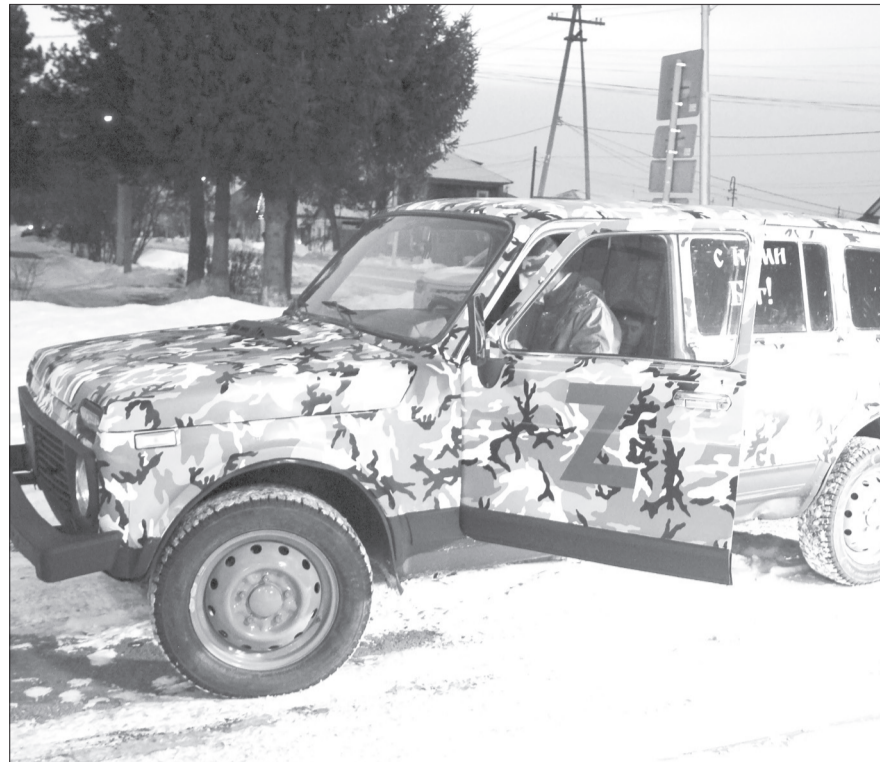
В тот же день подаренную «Ниву» отправили на загрузку гуманитарной помощью