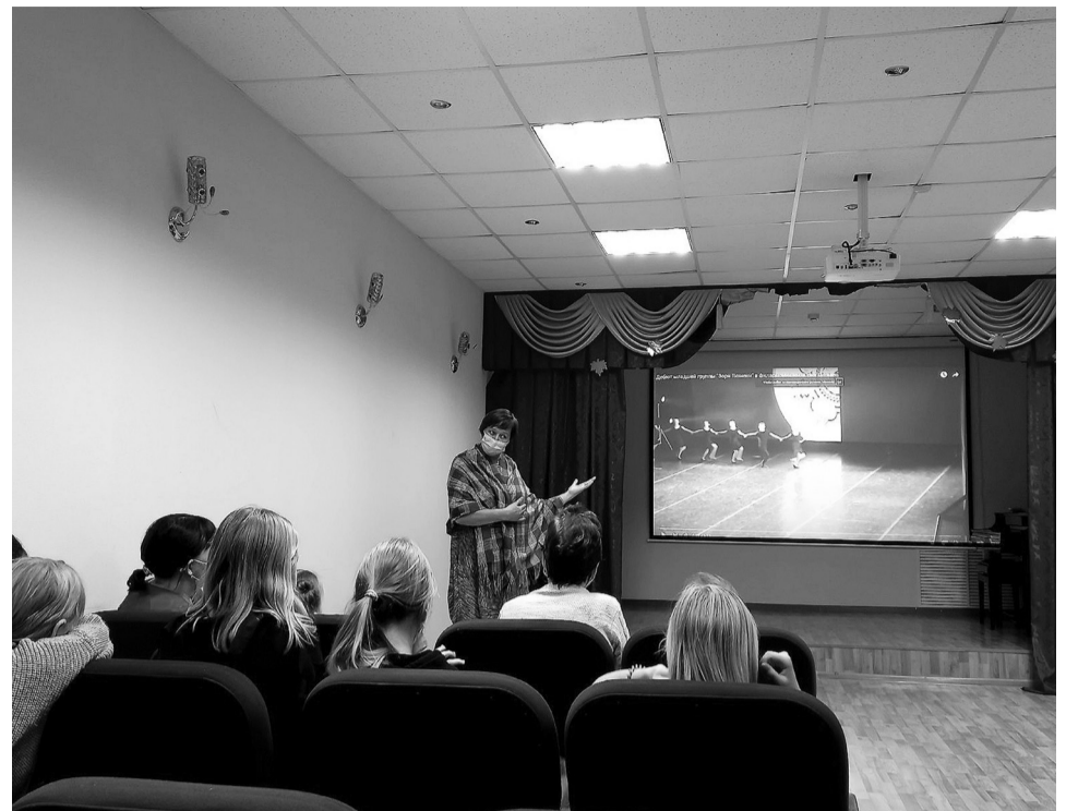
Преимущество виртуального концертного зала – в ощущении полного погружения в процесс происходящего

Многие сорокинцы с удовольствием и с чувством восторга смотрели выступления этого коллектива и у нас, на сцене районного Дома культуры. Мне, как руководителю отделения хореографии, хотелось не только ещё раз познакомиться с детьми и их родителей с танцевальным