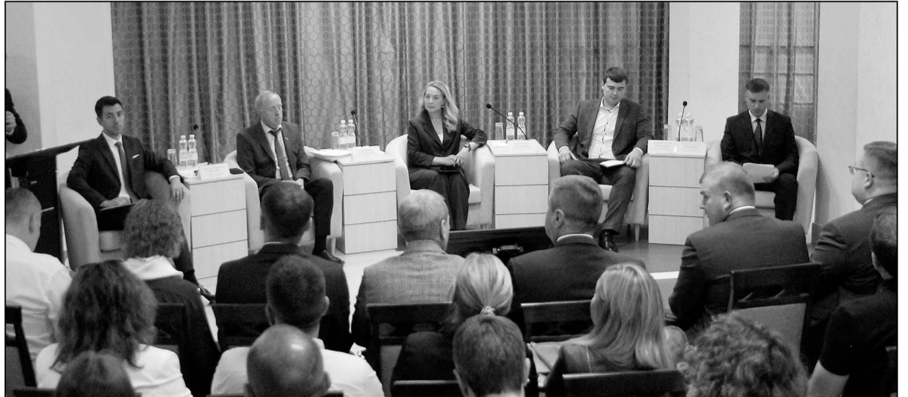
Вопросы малоэтажного строительства были среди обсуждаемых на форуме.