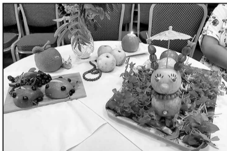
Фруктовые композиции из яблок в Червишевском клубе.

В рамках фестиваля в Онохино состоялась творческая встреча с семьями, где