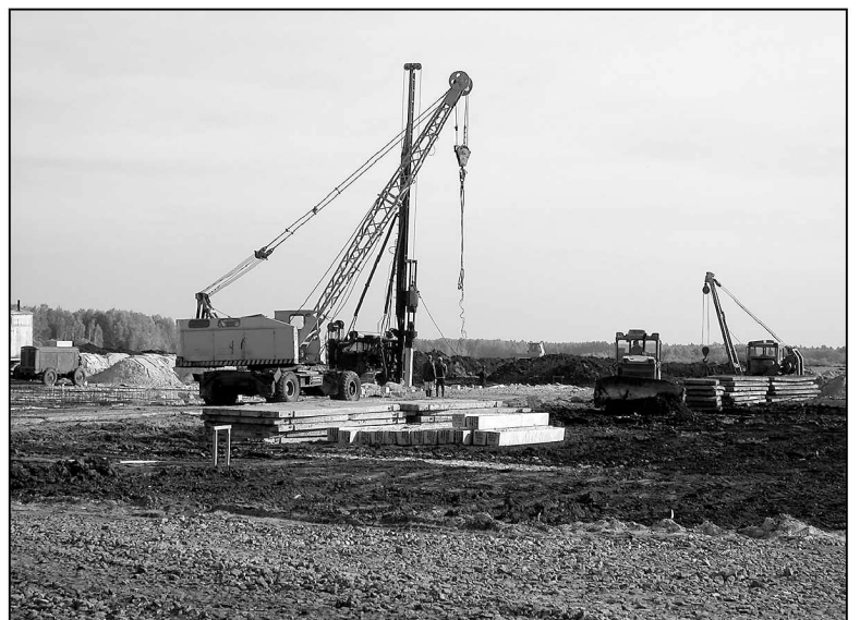
На стройплощадке поселка Молодежный забивают первую сваю. 2006 год.

На птицефабрике «Боровская» открыт цех глубокой переработки яйца, аналогов которому нет