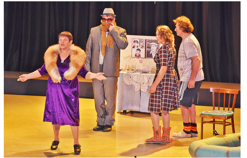
Самодельные артисты из студии «Родная сторонка» Пешнёвского дома культуры покорили зрителей своей игрой

16 декабря поднялся волшебный занавес театральной сцены районного дома культуры. В этот вечер артисты из села Пешнёво представили народную комедию «Жизнь такая штука» по мотивам пьесы И. Муренко «Шутки в глухомани».