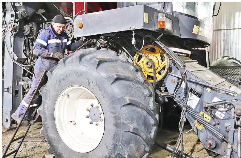
Качественно сделанный ремонт техники повышает производительность сельхозпредприятия