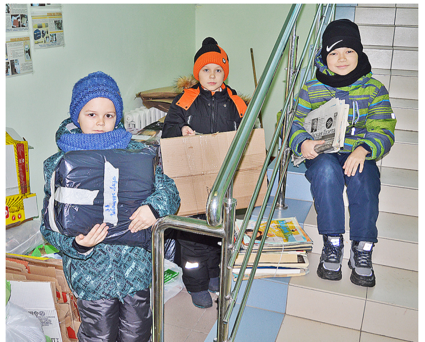
Ученики начальных классов Казанской школы охотно включаются в сбор макулатуры

В первых числах декабря в складском помещении Казанской начальной школы насчитывалось 700 килограммов макулатуры, а на начало января цифра составила 1874 кг.