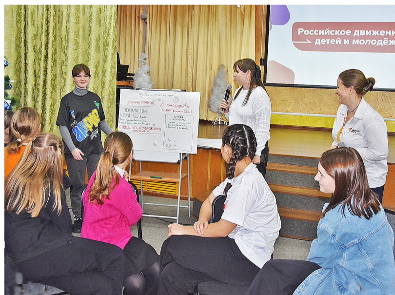
Ребята легко и быстро защитили план мероприятий

У казанских школьников существует много наработок, которые в дальнейшем могут быть воплощены в рамках работы нового