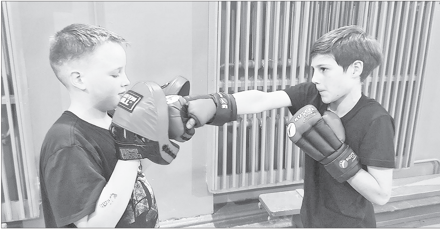
📷 Это не Спарта, это Нижнетавдинский район. Мужают юные школьники, занимаясь в секции рукопашного боя.