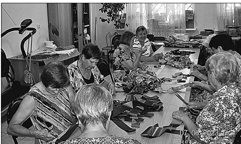
Ветераны п. Боровский делают маскировочные сети.

Жители «столичного» передают гуманитарную помощь участникам СВО.