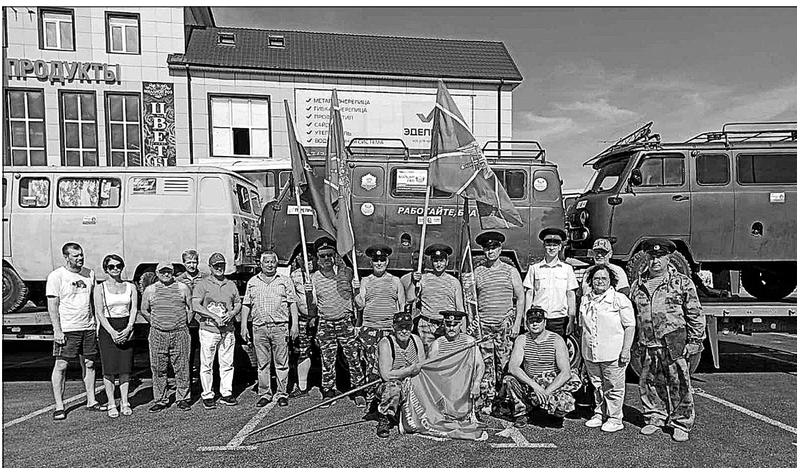
Жители Успенки подготовили подарки в зону СВО.