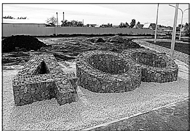
Арт-объект в парке посвящен 400-летию Успенки.