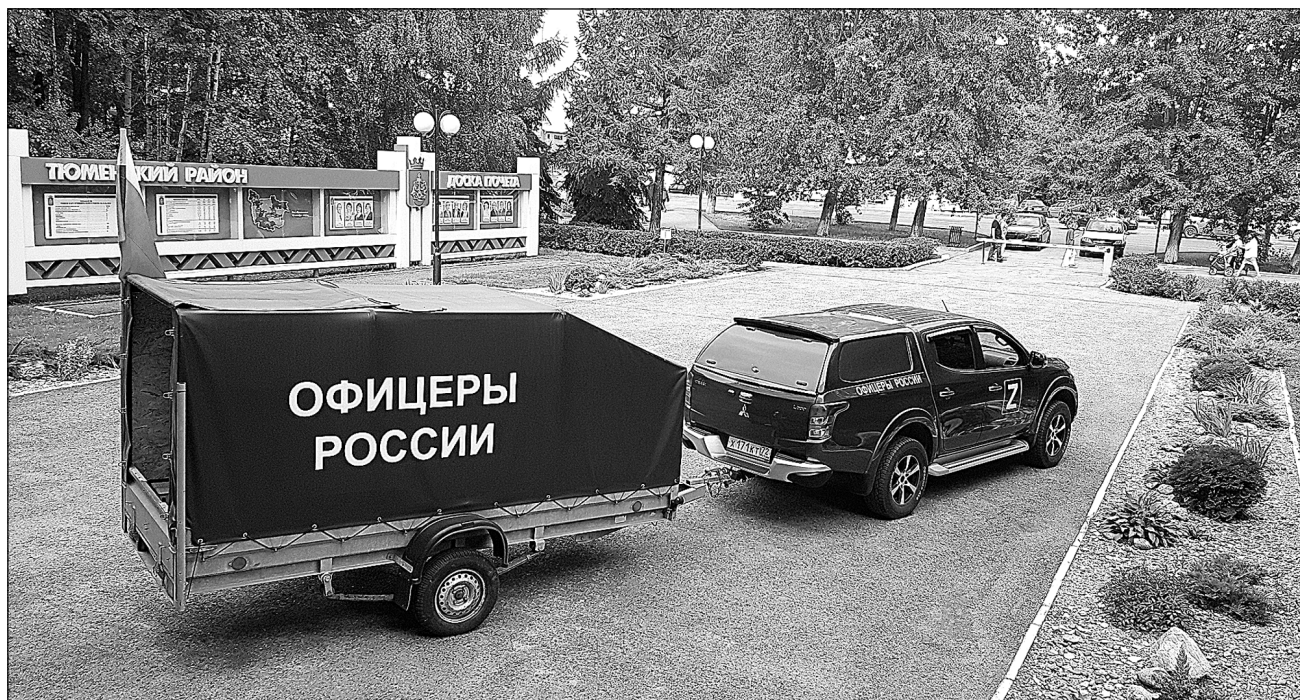
От администрации Тюменского района автомобиль с грузом медикаментов отправится в зону СВО.