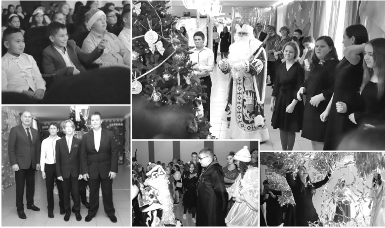
Праздничное настроение школьникам дарили артисты Дворца культуры «Юность»