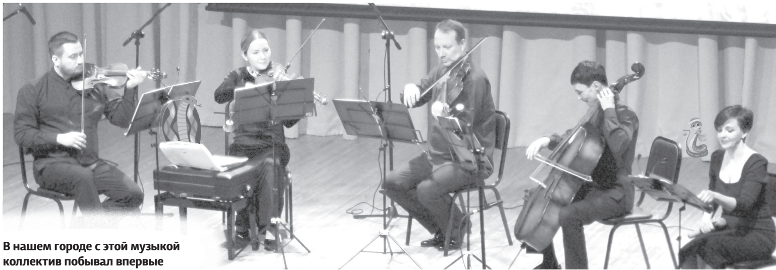
В нашем городе с этой музыкой коллектив побывал впервые