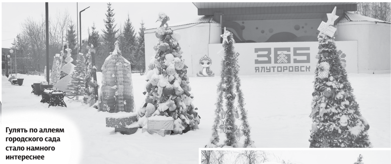
Гулять по аллеям городского сада стало намного интереснее

Надо признать, что остальные ничуть не хуже по замыслу и полёту фантазии. Посмотреть на них по-прежнему можно в городском саду.