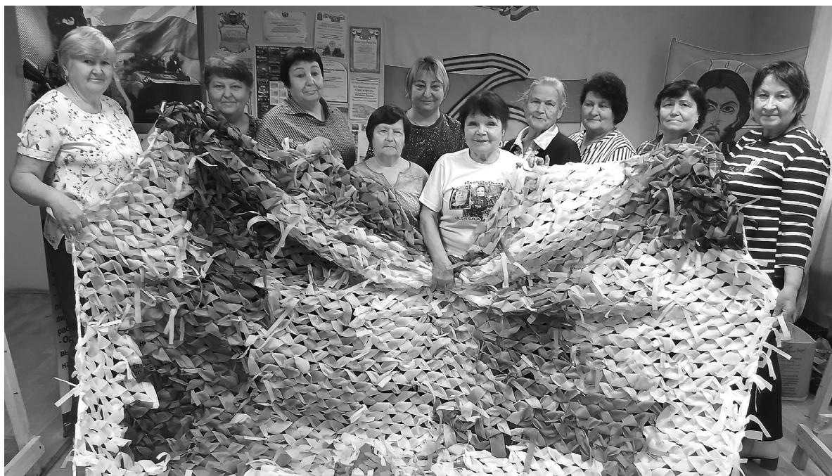
Активисты волонтерского штаба «СВОих не бросаем» готовят маскировочные сети в зимней расцветке

Волонтерский штаб «СВОих не бросаем» отметил день рождения. Объединению добровольцев исполнился год.