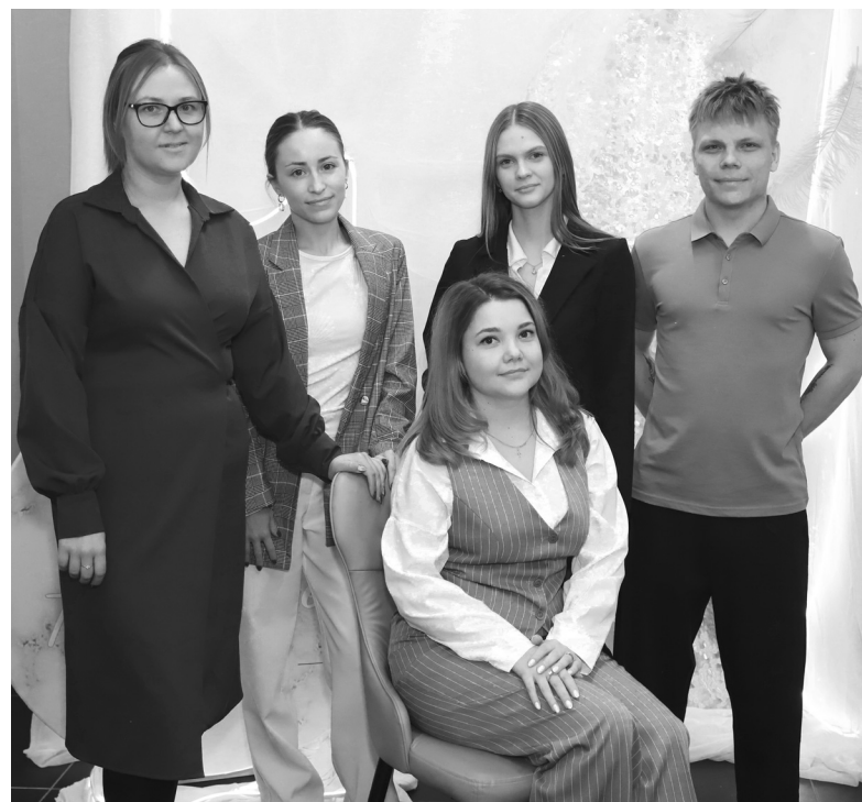
Команда студии красоты «Anastel»

Наталья ГЛАДКОВСКАЯ