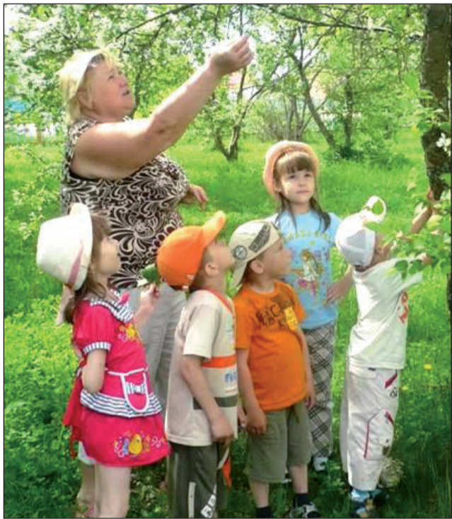
Уважаемые педагоги, работники детских садов района, ветераны дошкольного образования!

• 27 сентября - День работников дошкольного образования