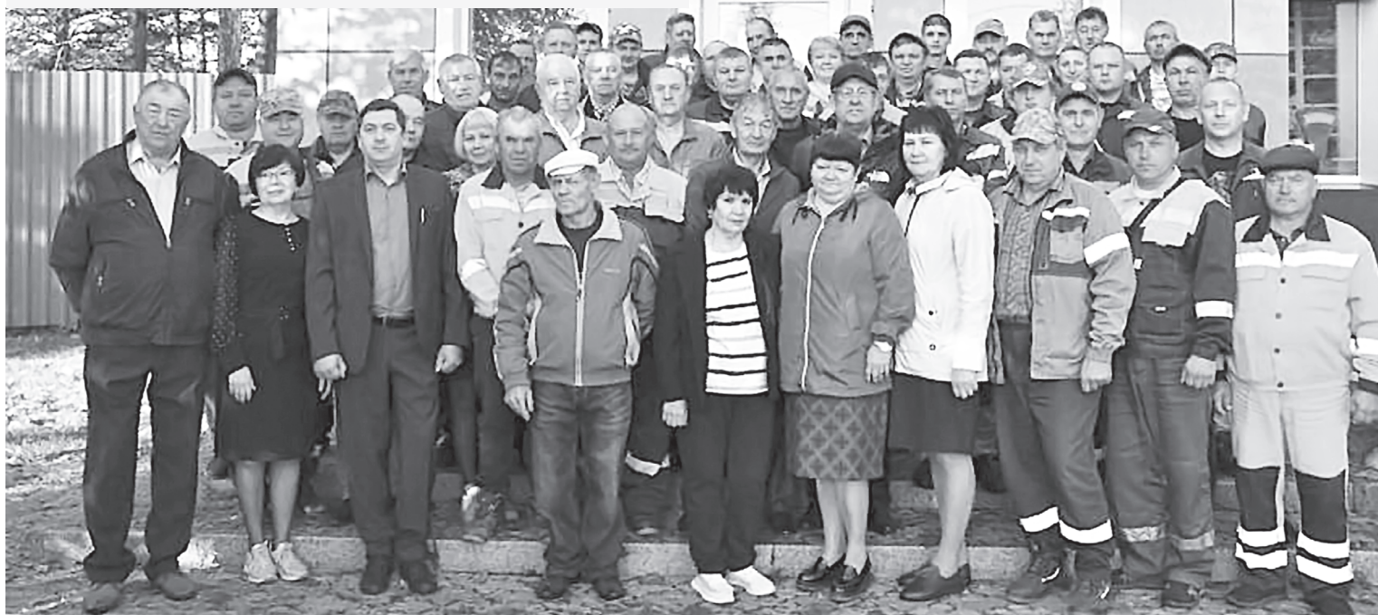
Поздравления с профессиональным праздником принимают ветераны и сегодняшний коллектив юргинских дорожников