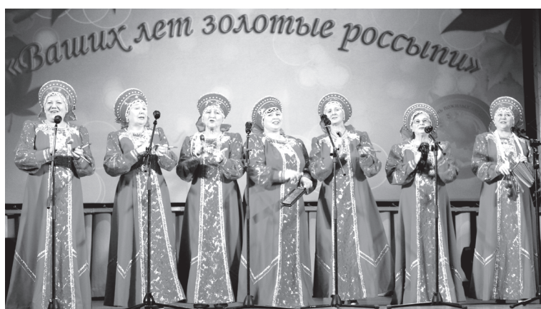
Победители в номинации «Вокальный коллектив» – «Кумушки» из Лабинской первичной ветеранской организации

Почётными грамотами главы Юргинского района за значительный вклад в развитие ветеранского движения, плодотворную деятельность по поддержке граждан старшего поколения, активное участие в патриотическом, духовно-нравственном воспитании молодёжи, сохранении истории родного края, за помощь бойцам, находящимся на СВО, наградили