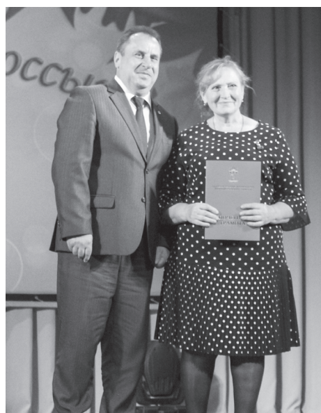
Прошло награждение представителей ПВО