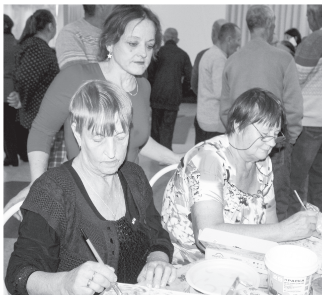
Рисование – способ привести в порядок мысли

Мария ЗОЛОТАРЕВА