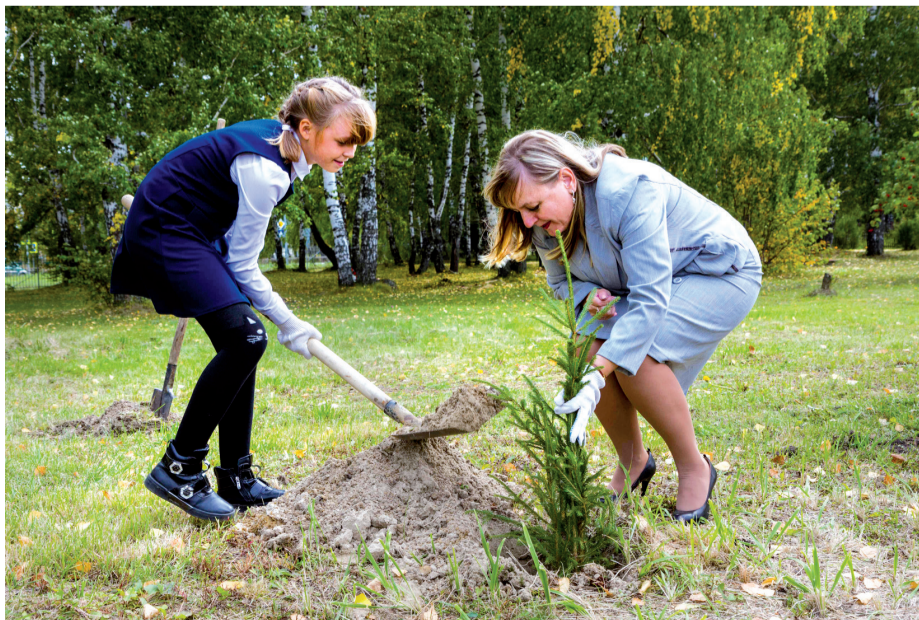
Аллея – на память будущим поколениям

Вместе с почетными гостями мальчишки и девчонки посадили саженцы, заложили будущую аллею на территории школы. И таким образом внесли свой вклад в экологическую акцию «Чистый лес».