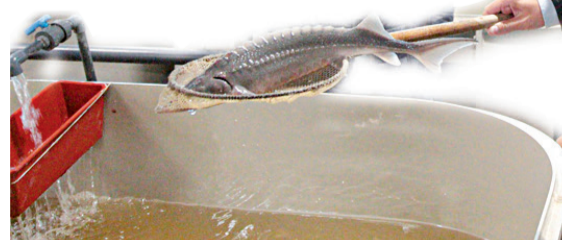
Знакомство с осетровыми

руте стал посёлок Рыборазводный, где расположен Абакский экспериментальный рыборазводный завод Нижне-Обского филиала ФГБУ «Главрыбвод».