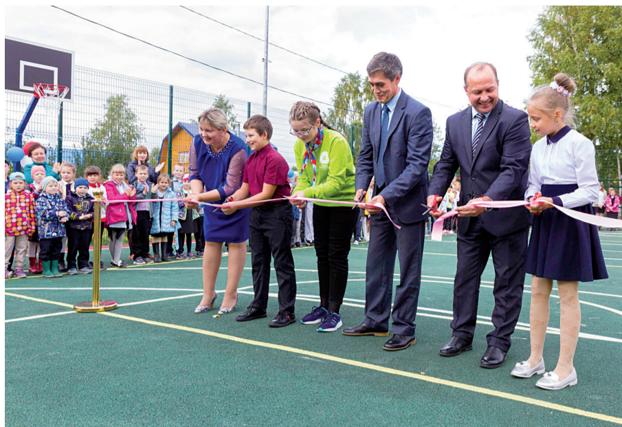
С новосельем, спортсмены!