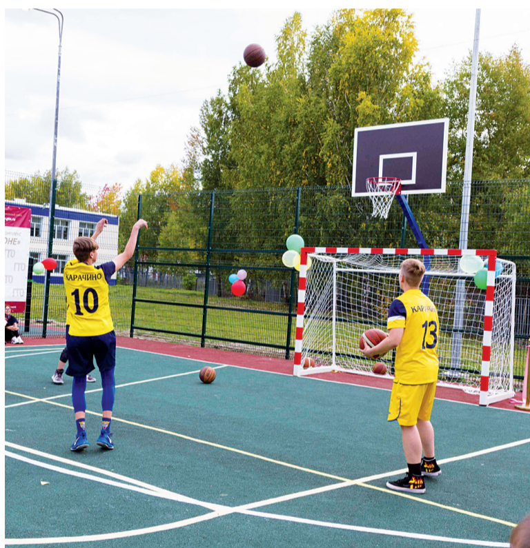
Новые возможности для баскетболистов

...По рядам школьников, выстроившихся на торжественную линейку, прокатилась радостная