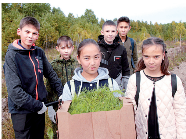
Друзья леса с любовью к природе

От того, насколько правильно будет выбрано место для постоянной «прописки» новых деревьев, во многом зависит успех всех лесовосстановительных работ. Главным помощником в этом деле выступает опыт, которого у наших лесников предостаточно. И уже после заделки семян в течение нескольких лет за их ростом лесники ведут наблюдение.