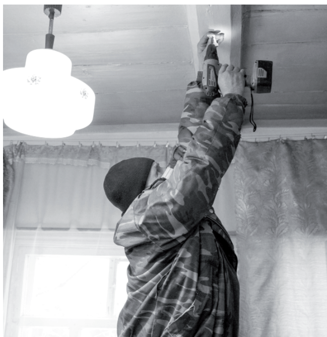
Датчики дыма специалисты рекомендуют устанавливать всем. Это не страховка от пожара, но при звуке извещателя человек успевает справиться с паникой, адекватно и своевременно отреагировать на возгорание.

– Когда человек зрение теряет, нужно просто изменить подход к привычным действиям, посидеть, подумать, как сделать. Приложишь голову – будет и результат. Вот, например, надо было мне доски напилить одного размера. Я одну отмерил, провел шилом метку, чтобы остался осязаемый след, и отпилил ножовкой. А уж потом по этому образцу и остальные, – говорит Александр Николаевич. – С потерей зрения вообще меняется темп жизни: появляется время остановиться, подумать. И становится очевидным многое, мимо чего мы обычно в повседневной суете пробегаем. Не зря же говорят, что жизнь хороша, когда идет не спеша. И может быть при этом не менее полноценной, главное – изменить отношение к своему состоянию, которое только кажется беспомощным. И тогда увидишь новые возможности.