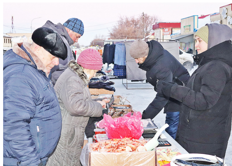
Морепродукты всегда пользуются спросом, а к праздничному столу особенно

ки всем активным участникам уличной торговли вручены грамоты от администрации Казанского райо-