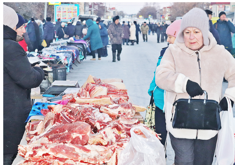
На ярмарке представлена широкая линейка свежего мяса

шельки, которые наверняка к концу торгового дня заметно истощились. А чтобы настроение было на высоте, мероприятие сопровождалось культурно-массовой программой, организованной работниками районного дома культуры, где главные действующие лица – Дед Мороз и Снегурочка. По итогам ярмар-