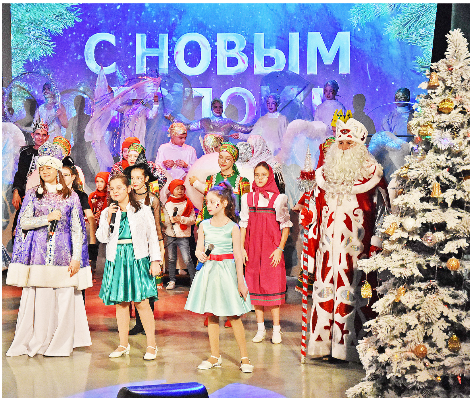
Праздничная программа для детей получилась яркой и запоминающейся

Информации подготовила Светлана СУРОВЦЕВА