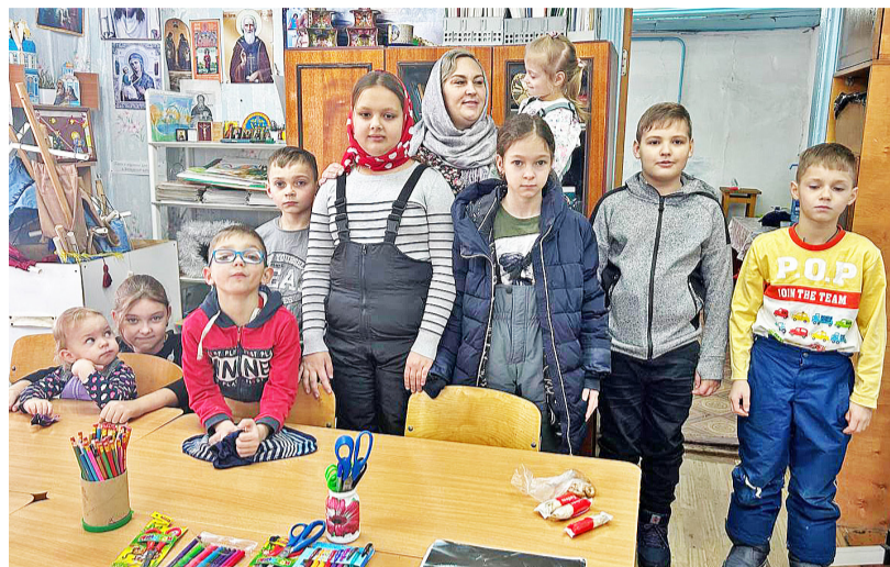
После воскресной литургии дети приступают к занятиям

Она рассказала ребятам о праздновании Рождества Христова,