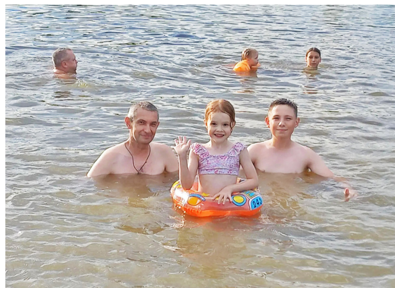
Пусть летние каникулы ничто не омрачит

Заселение в гостиницы во время путешествия по России