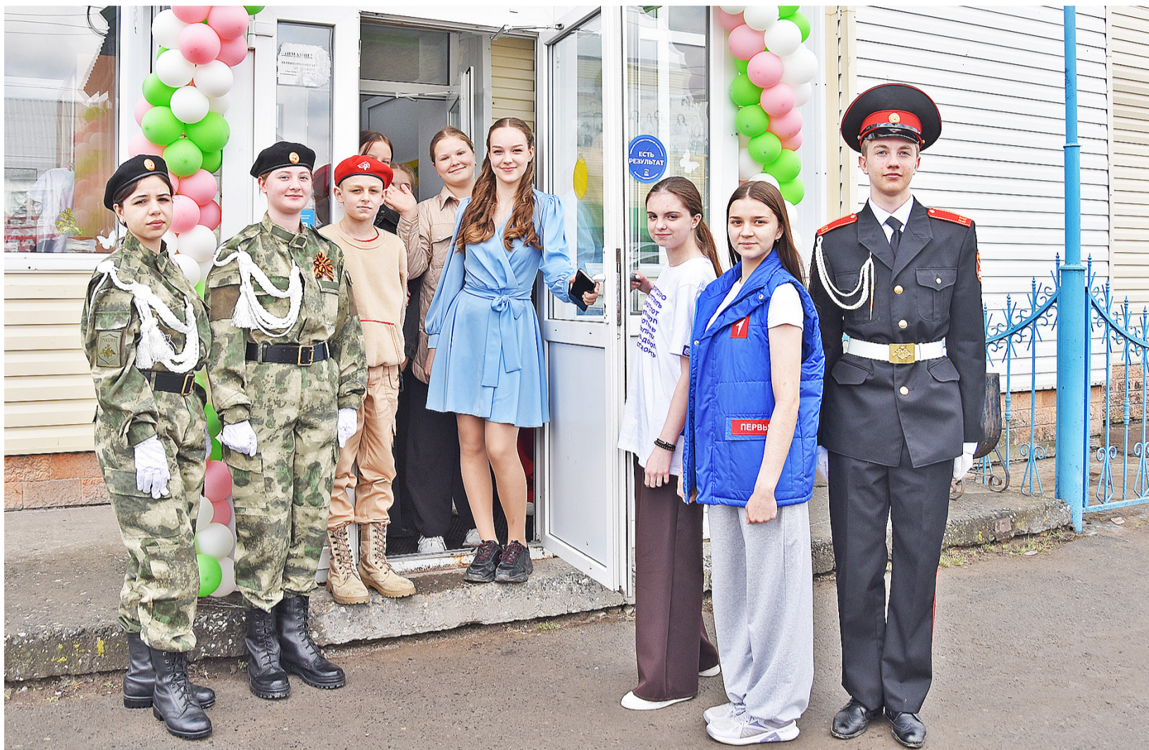
Казанский центр развития детей распахнул двери после капитального ремонта