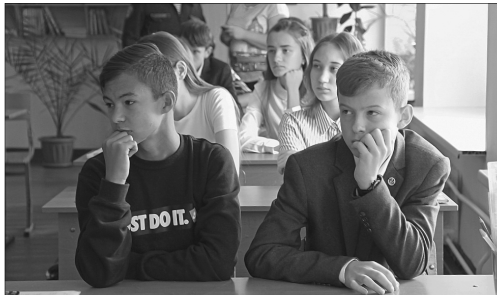
Учащиеся 9 класса, затаив дыхание, смотрели фильм о Герое России