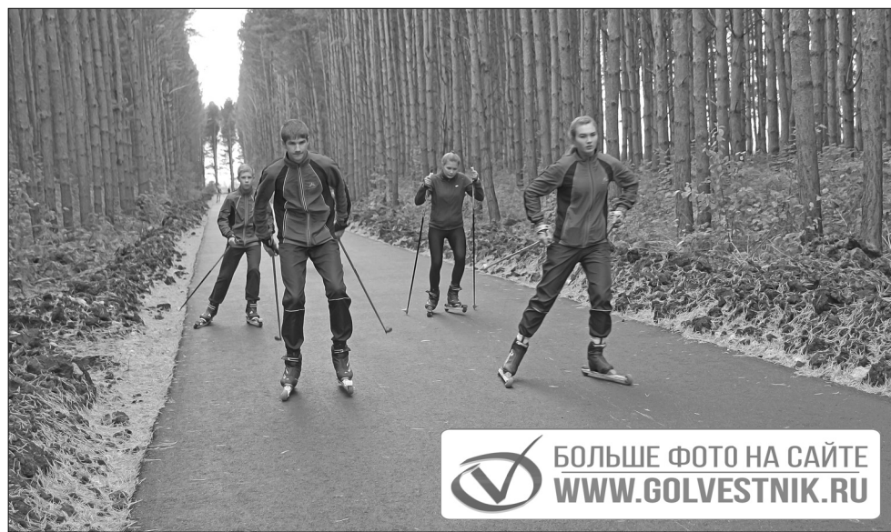
Трасса отличная! Роллеры катаются мягко, и скорость развивается хорошая