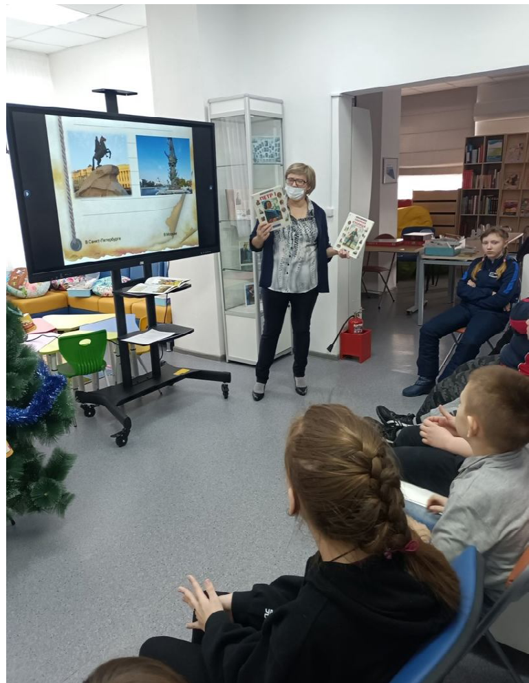
В Ситниковской модельной библиотеке прошел познавательный игровой час «В Европу прорубил окно»

Осенью прошлого года Центр информационно-библиотечного обслуживания Омутинского района стал обладателем гранта в размере 5 млн руб. в конкурсе на создание модельных муниципальных библиотек в рамках нацпроекта «Культура». Благодаря этому в с. Ситниково появилась современная модельная библиотека, которая стала огромным шагом в развитии библиотечного обслуживания жителей сельской глубинки.