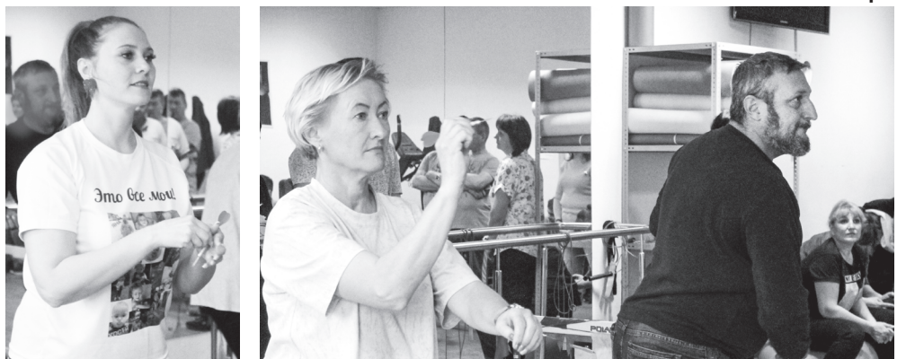
Что главное в дартсе? Стремление попасть в «яблочко»