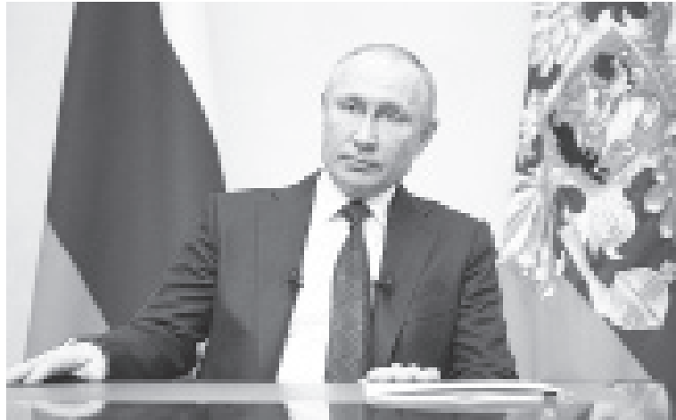
|| Фото с сайта http://www.kremlin.ru/

должить устойчивую работу и сохранить сотрудников. Предлагаю для предприятий и отраслей, которых особенно затронула ситуация с коронавирусом, предоставить отсрочку по всем налогам за исключением НДС на 6 месяцев, а для микропредприятий также дать отсрочку по страховым взносам.