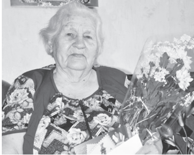
|| Фото автора

– С нами ещё жила папина мама, а потом ещё и его тётка старая. Может, семьям с одним-двумя детьми полегче было, а