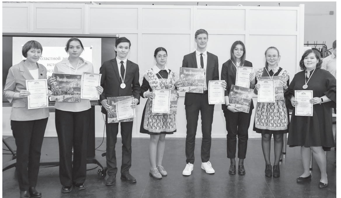
Команда Ярковского района