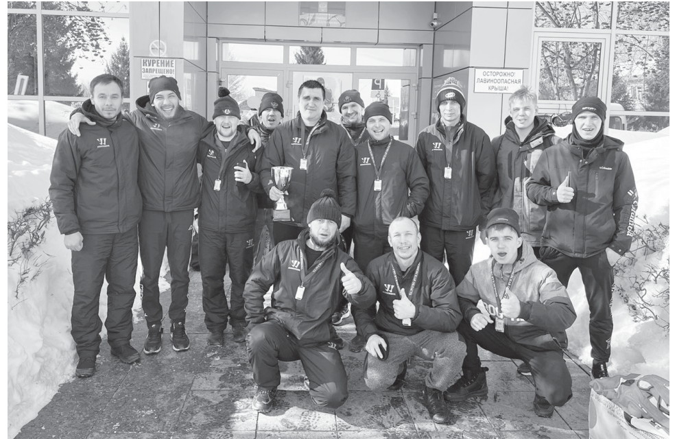
«Сибиряку» вручили серебряные медали чемпионата Тюменской области

Другой турнир, в котором принимала участие команда Ярковского района – Ночная хоккейная лига, стартовавшая в сентябре. Но если в чемпионате области разрешено