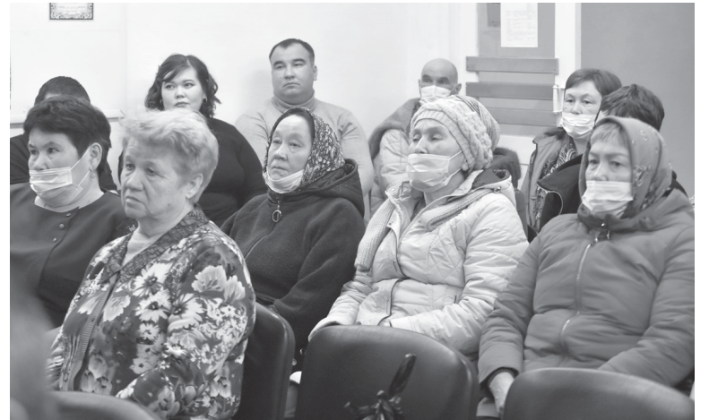
Во второй части мероприятия маранцы заслушали отчет главы поселения о проделанной в 2021 году работе

От дорожной тематики селяне, обратившиеся на личный прием, вновь вернулись к вопросам, связанным с отоплением. Но речь на этот раз шла уже не о дровах, а о газификации населенных пунктов. Данная проблема актуальна для каждого из трех поселений «Зареки»: местным жителям дав-