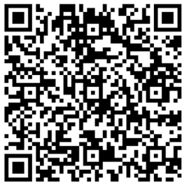
Смотрите фото на нашем сайте «Исетск72»

Торжественный митинг в честь 95-летия Воздушно-десантных войск стал не просто мероприятием, а настоящим воплощением духа ВДВ: мужества, чести, верности, нерушимой братской связи тех, кто однажды выбрал небо своим домом и безграничной любви к Родине. Этот день ещё раз напомнил о тех, кто готов встать на защиту Отечества, о тех, кто всегда готов к подвигу.