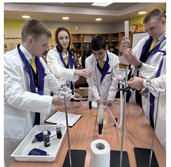
«Отдел транспорта» проводит физический эксперимент.

Ярким событием недели естественно-математических наук, которая прошла в школе в начале февраля, стал хакатон «Eco-Drill 2030». Участникам предстояло за ограниченное время разработать концепцию буровой установки будущего. Особенностью мероприятия стали смешанные команды: ученики 10-11-х «РН-классов» работали в тандеме, обмениваясь опытом и идеями. Перед ребятами стояли вызовы, актуальные для «Роснефти»: энергоэффективность, экологическая безопасность