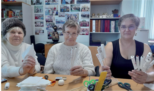
Спички добра - от пенсионеров села Уват.

В каждом селе кипит работа. Активисты советов ветеранов изготавливают маскировочные сети, окопные свечи, собирают гуманитарный груз, формируют посылки для наших бойцов. Каждый из ветеранов уверен, что всё, чем они помогают бойцам, сэкономит парней, облегчит им солдатский быт.