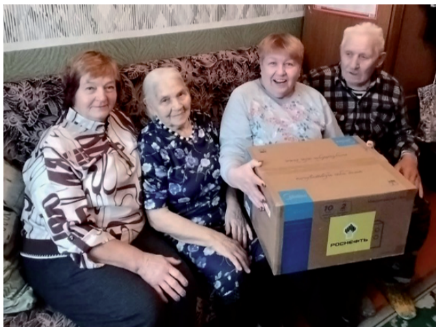
Забота о ветеранах.