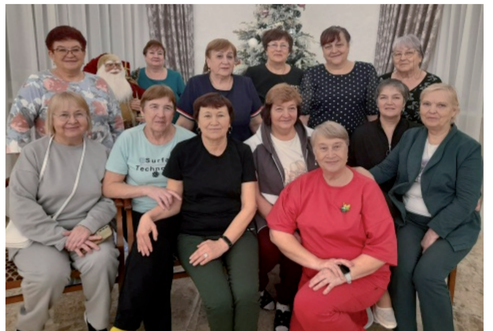
«Отряд особого назначения» поправляет здоровье в санатории «Градостроитель».

Новогодний костюмированный бал для активистов первичных советов ветеранов прошел в ФОКе «Иртыш». Творчество в предновогодние дни - не просто способ выразить себя, это возможность делиться радостью с окружающими, создавая что-то уникальное и особенное для этого волшебного времени. То, что воплощается в эти дни, часто остается в памяти на долгие годы, будучи частью новогодней традиции.