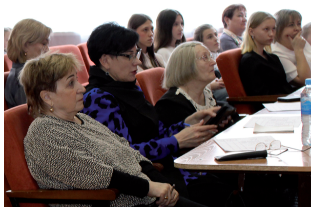
Члены жюри с огромным интересом слушали каждое выступление.