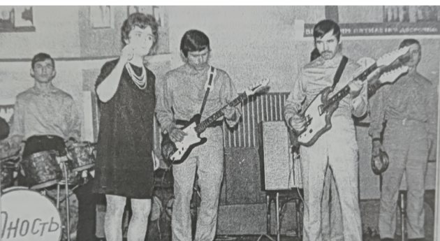
газета «Уватские известия», 2002 год