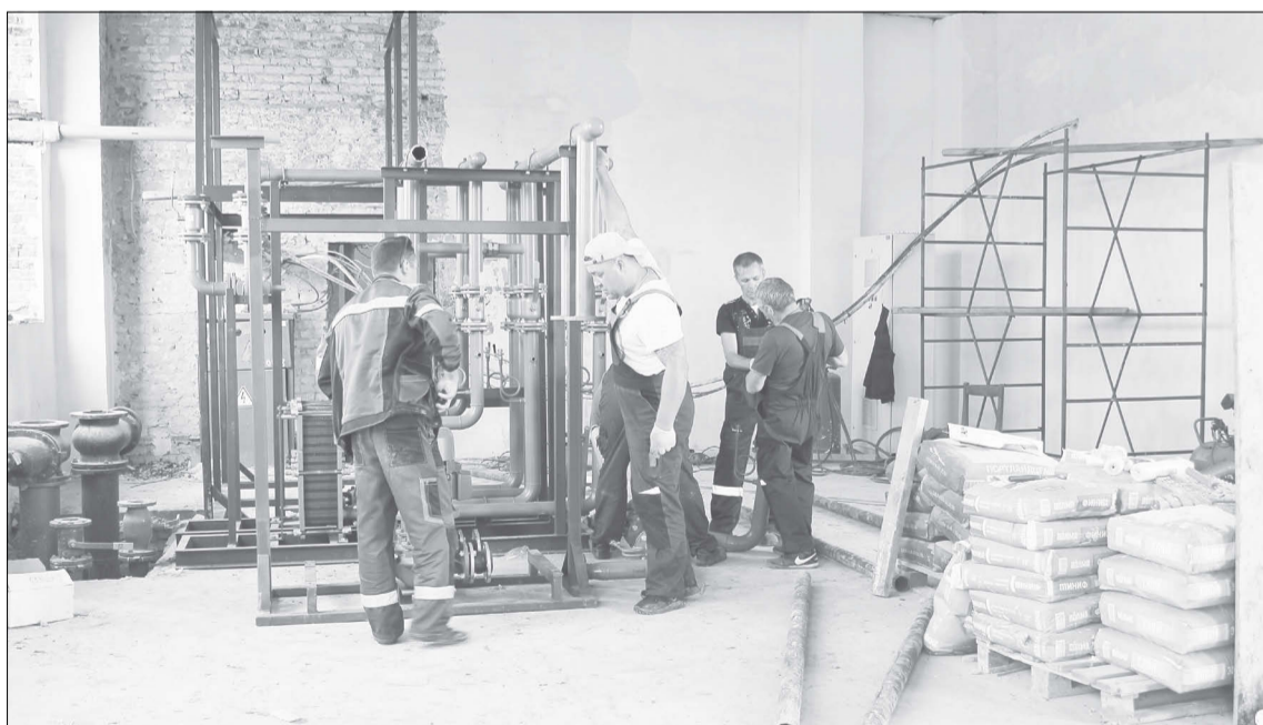
От старой котельной на улице Ентальцева останутся только кирпичные стены. Здесь меняют всё!

- Раньше тут был теплообменник для горячей воды. При плюсовых температурах на улице вода не нагревалась, - детально объяснил Фёдор Геннадьевич. - Поэтому по просьбам местных жителей городская администрация согласо-