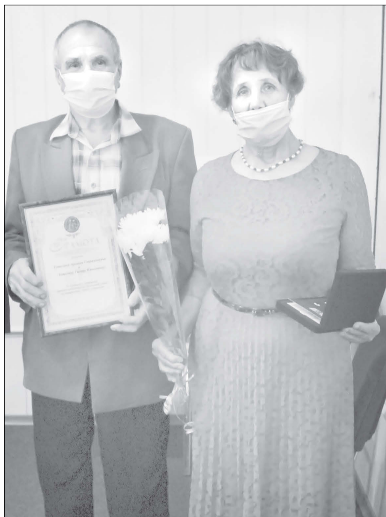
Супруги Тотолины отметили 52 года со дня свадьбы, а вместе они со школьной скамьи

В Ялуторовском районе чествовали супружеские пары, которые прожили вместе более тридцати и пятидесяти лет