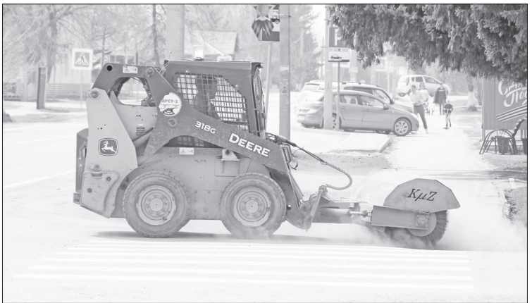
Дорожники продолжают приводить улицы в порядок.

чит, не зря родители и учителя рассказывали о героях Великой Отечественной войны.