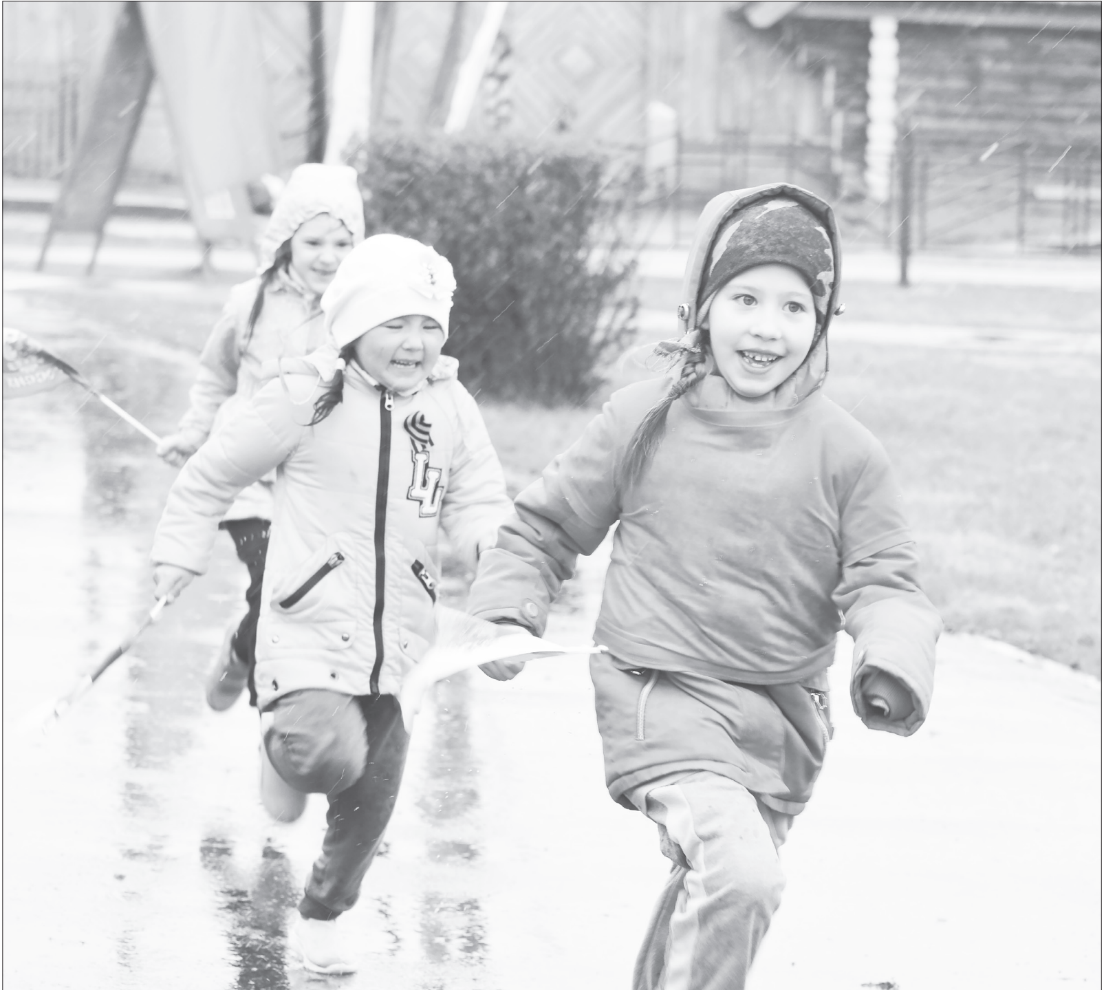
📷 Все малыши пробежали свои этапы задорно, шумно. Каждый из них получил сладкий приз от службы заказа такси.

«Победная» эстафета объединила малышей и школьников – от начального до старшего звена. Несмотря на «нелётную» погоду ребята не отступили от цели и проявили железный характер. Награждали их в более тёплой атмосфере – в стенах ЦКиД «Сибирь».