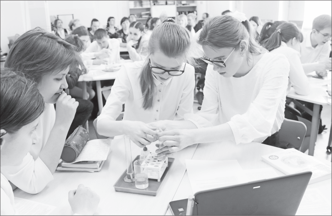
Фрагмент интегрированного урока (обществознание и биология).

В Нижней Тавде прошёл семинар «Цифровая образовательная среда – новые возможности развития»