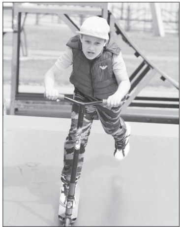
Этому «шумахеру» любимые горки по плечу!