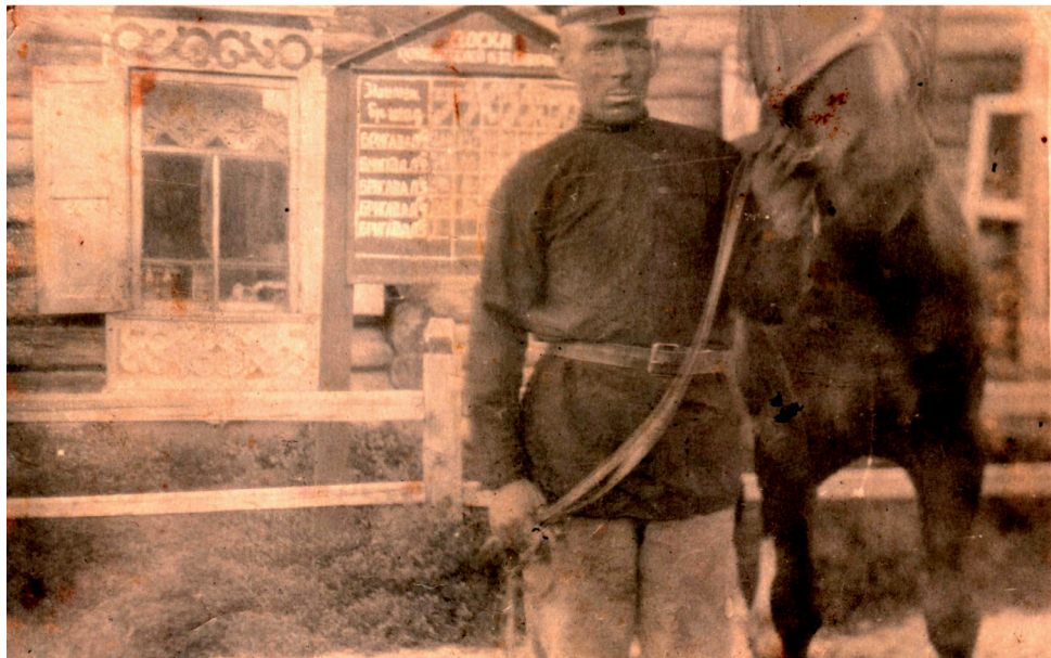
Колхозник на фоне Доски социалистического соревнования колхоза «Северный».