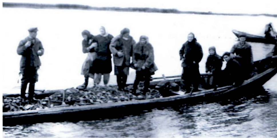
Рыбачий неводник на Буренском песке.

Селяне брали обязательство к 1 августа отремонтировать уборочные машины и жатки, к 10 августа подготовить молотилки, а к 15 августа - направление токов.