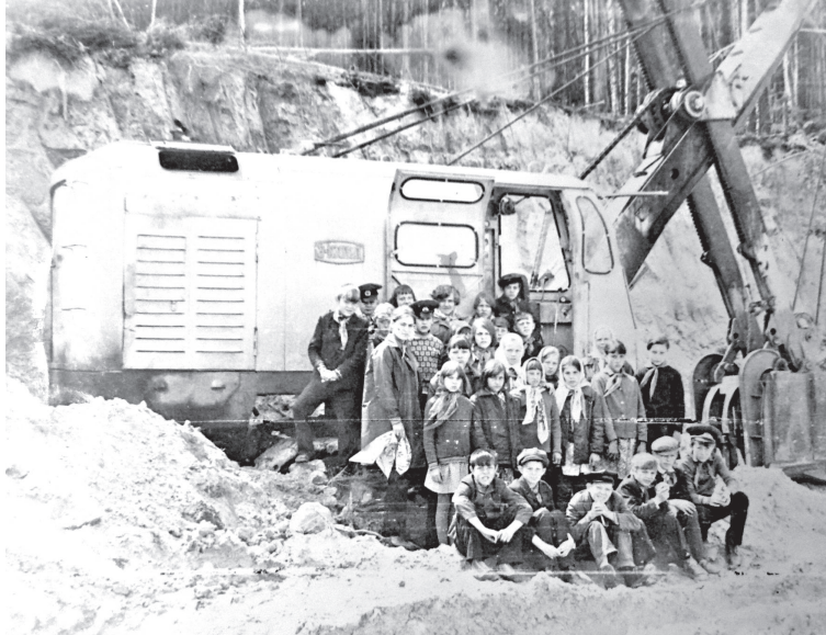
• Нередко на песчаный карьер на экскурсию приезжали школьники. Побывали здесь в середине 80-х годов и пятиклассники Тумашовской средней школы.