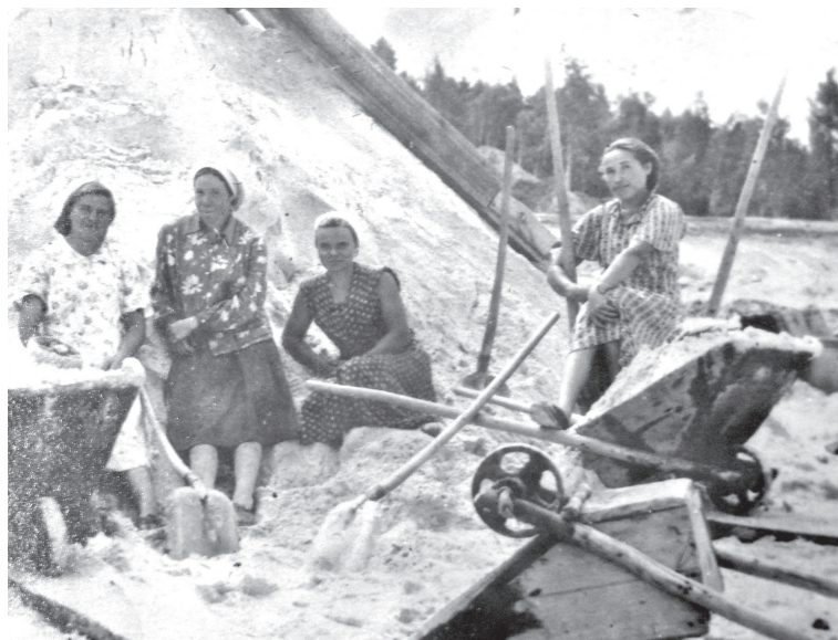
• Песок до появления техники добывали вручную шахтным способом. Мужчины орудовали лопатой и кайлом, а женщины тачками вывозили песок до места погрузки в железнодорожные вагоны.

Подготовил Андрей КОРОСТЕЛЁВ