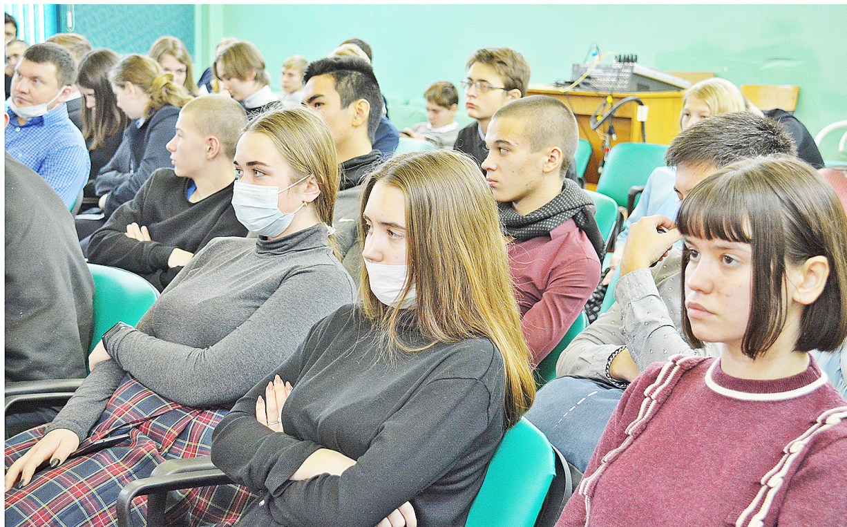
Возможно, кто-то из этих ребят выберет профессию, связанную с отраслями сельского хозяйства

Работа начинается ещё в детском саду. Ребятишки под руководством педагогов делают грядки на приусадебном участке дачи, выращивают овощи: сами сеют семена, поливают, наблюдают за ростом растений, собирают урожай. На занятиях воспитатели рассказывают малышам о сельскохозяйственных животных, растениях, о