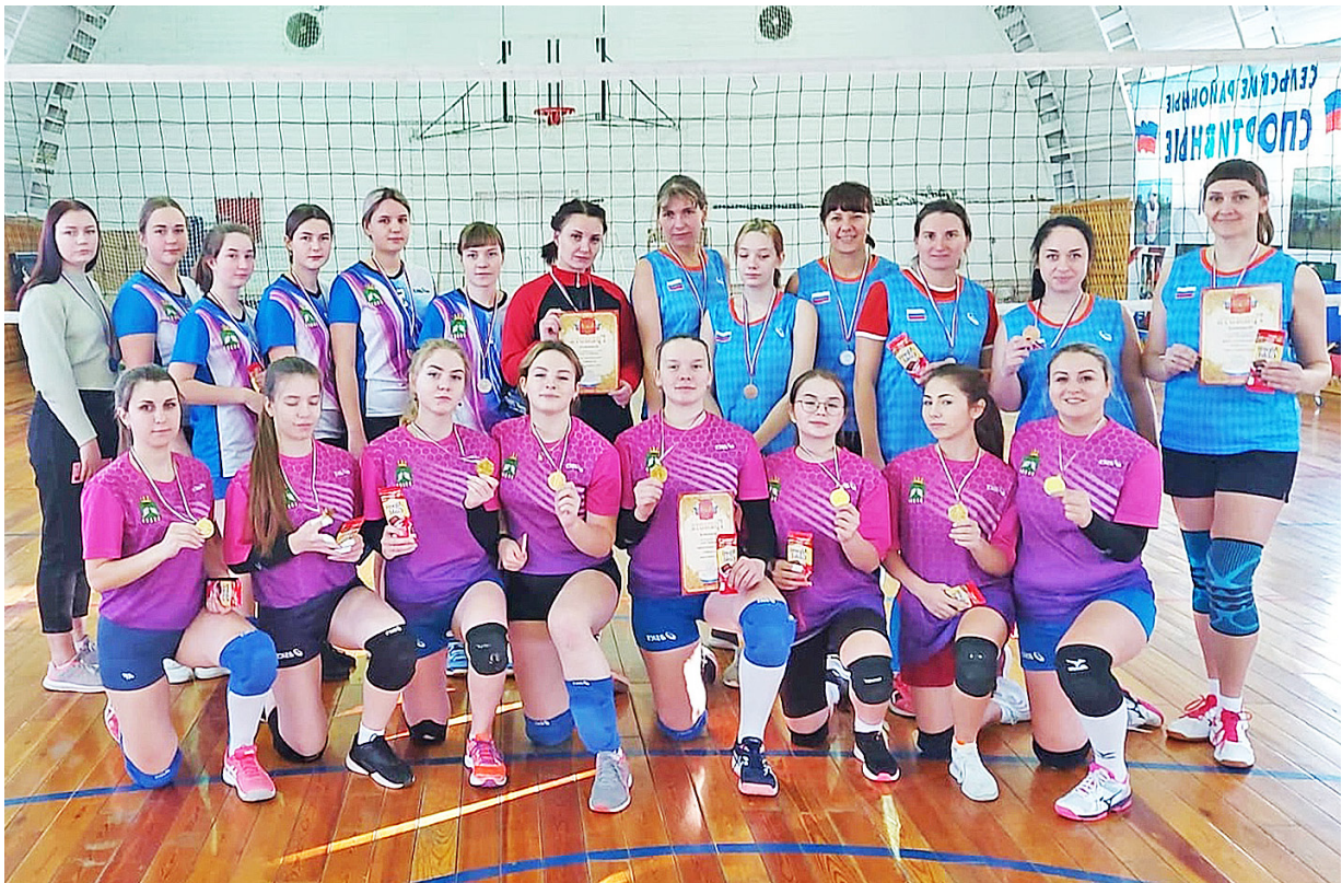
Поздравляем команду с победой в чемпионате города. Они показали отличные результаты и заслужили награды.

В своей работе он всегда стремится к совершенству. Он считает, что только так можно добиться высоких результатов. Он всегда готов к новым вызовам и трудностям. Его деятельность является примером для многих других людей, которые хотят добиться успеха в своей жизни.