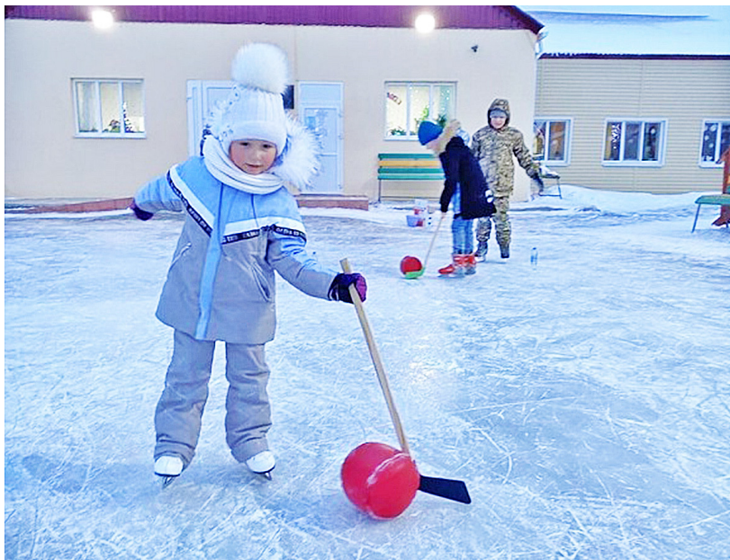
Вместе весело шагать по снегу. Дети играют в снежки в парке.

В своей работе он всегда стремится к совершенству. Он считает, что только так можно добиться высоких результатов. Он всегда готов к новым вызовам и трудностям. Его деятельность является примером для многих других людей, которые хотят добиться успеха в своей жизни.