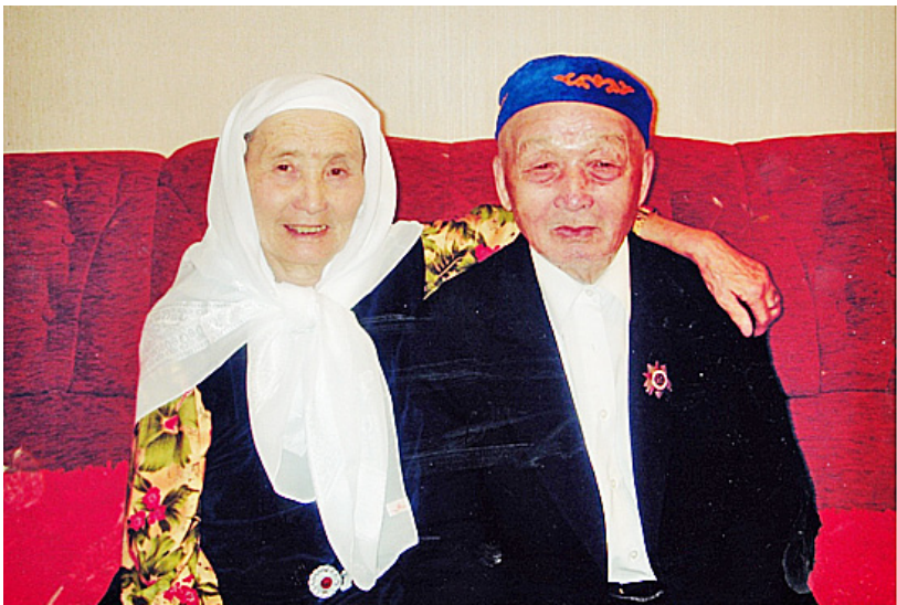
Поздравляем юбиляров с 50-летием свадьбы. Они прожили долгую и счастливую жизнь.

В своей работе он всегда стремится к совершенству. Он считает, что только так можно добиться высоких результатов. Он всегда готов к новым вызовам и трудностям. Его деятельность является примером для многих других людей, которые хотят добиться успеха в своей жизни.