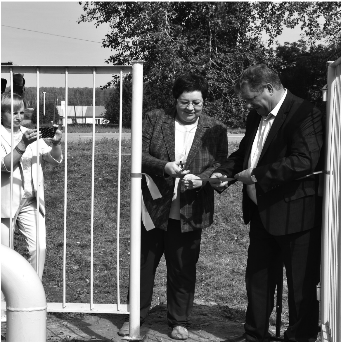
Фрагменты торжественного открытия газопровода в селе Готопутово

Нацпроекты. 28 августа состоялся торжественный запуск внутрипоселкового газопровода