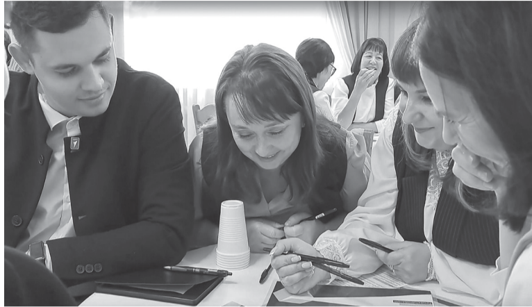
На игре "Школа социального проектирования"

Сергей Сергеевич высказал мысль о том, что поддержка педагогов и повышению престижа профессии учителя остаются ключевыми задачами и в новом учебном году. – В частности, решением президента России в марте этого года были удвоены надбавки классным руководителям и кураторам групп в колледжах в на-