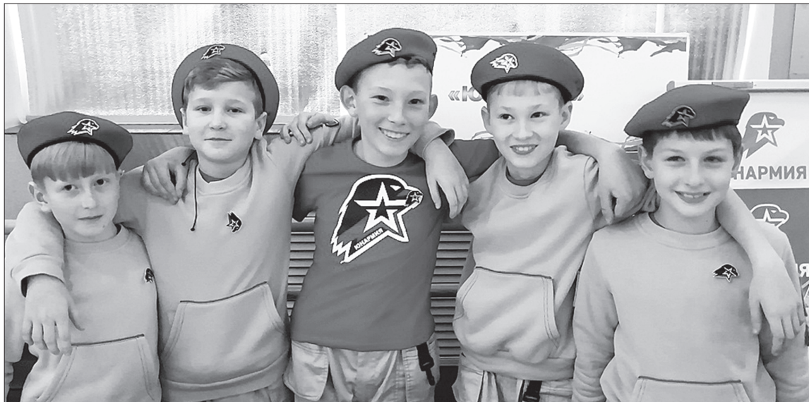
Юнармейцы клятвенно обязались быть верными Отечеству и братству

– «Юнармия» – это новая форма работы по патриотическому воспитанию детей и молодёжи. В Юргинском районе это направление уже не одно десятилетие реализуется через дея-