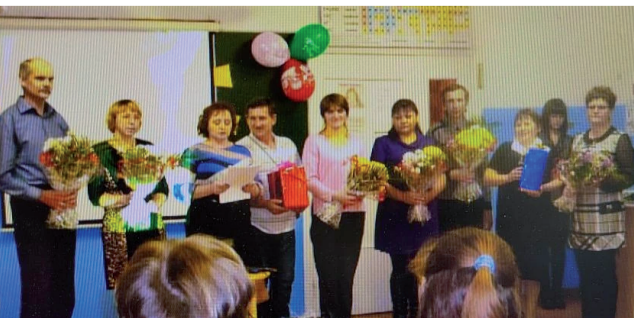
газета «Уватские известия», 2013 год