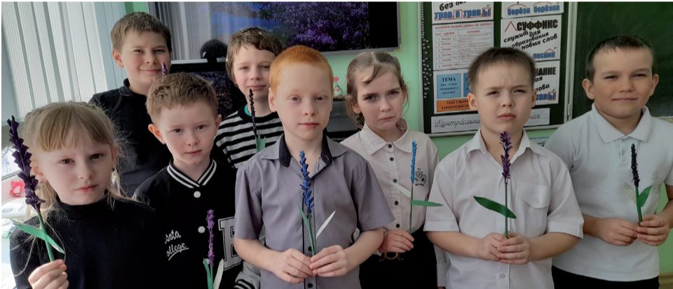
«Крымская лаванда» - частичка весны и единства.

Анастасия ДЕНИСОВА