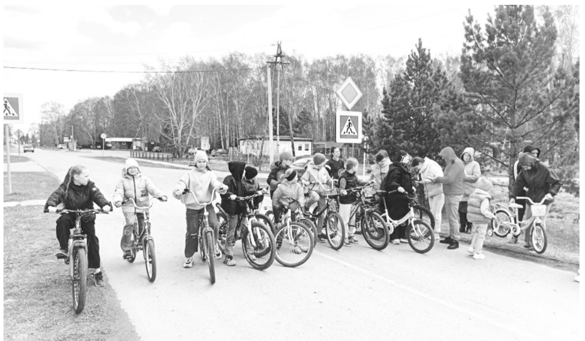
|| Фото из архива участников велогонки

Без наград ни остался никто, все участники соревнований получили утешительные призы.