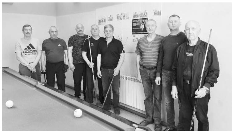
|| Фото из архива шороховского спорткомплекса

Участники признались, что остались очень довольны участием в этом замечательном турнире, посвящённом памяти нашего земляка, в подготовке которого активное участие приняли спортивная школа и Коргины-младшие.