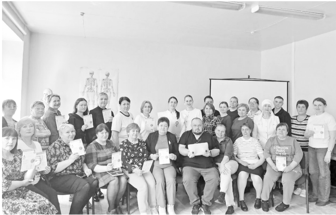
|| Участники обучающего семинара.

– На сегодняшний день онкологические заболевания женской половой сферы остаются одной из ведущих причин заболеваемости и смертности среди женского населения Тюменской области. Особую тревогу вызывает рост числа впервые выявленных случаев, что подчёркивает необходимость активной профилактической работы и