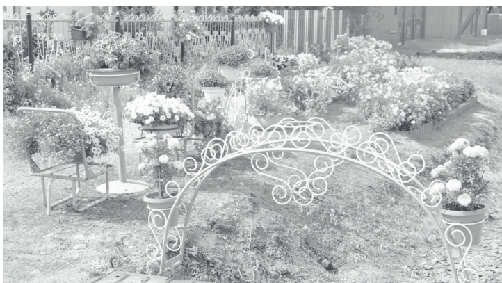
Так выглядит придомовая территория Мерзляковых.