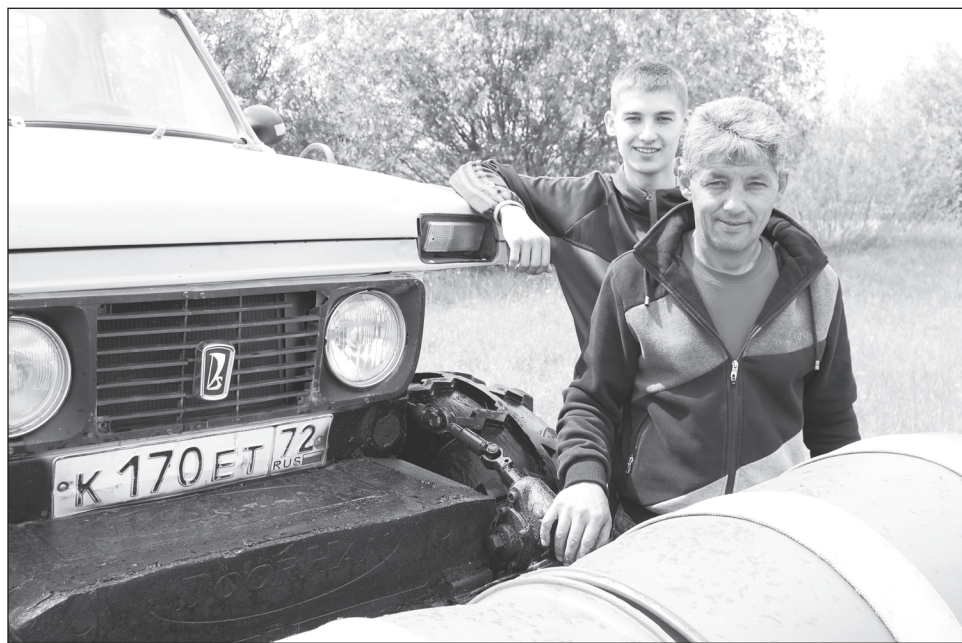
Конструкторы Белокуровы из Упорово довольны своим детищем.

ги, облегчив их предварительно. Зимой по глубокому снегу да по оврагам испытал свой снегоход. Не устроила машина конструктора, не на такие возможности её он рассчитывал. Но не бросил начатое дело мастер, а решил кардинально технику усовершенствовать, на «уазовскую» раму перенёс двигатель, все узлы и агрегаты, раздатку усилил, редукторы мостов усовершенствовал. Немало сложностей было с карданами, с повышением плавучести машины. Хотелось мастеру, чтобы его снегоболотоход преодолевал снежные и