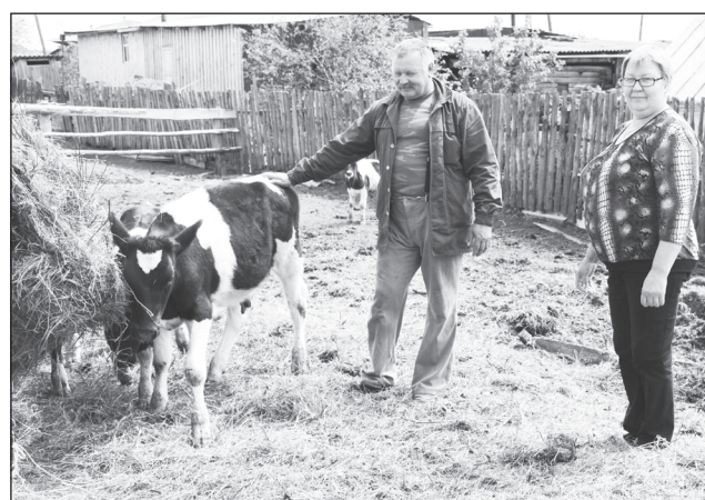
Молодняк для увеличения стада.

С увеличением количества детей, увеличивалась