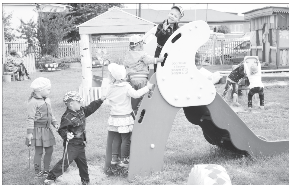
Коркинским малышам в родном детском саду уютно и весело всегда.

Коркинский детский сад «Золотая рыбка» для местной ребятни — райский уголок. И создана эта красота заботливыми руками воспитателей, конечно же, не без помощи родителей малышей.