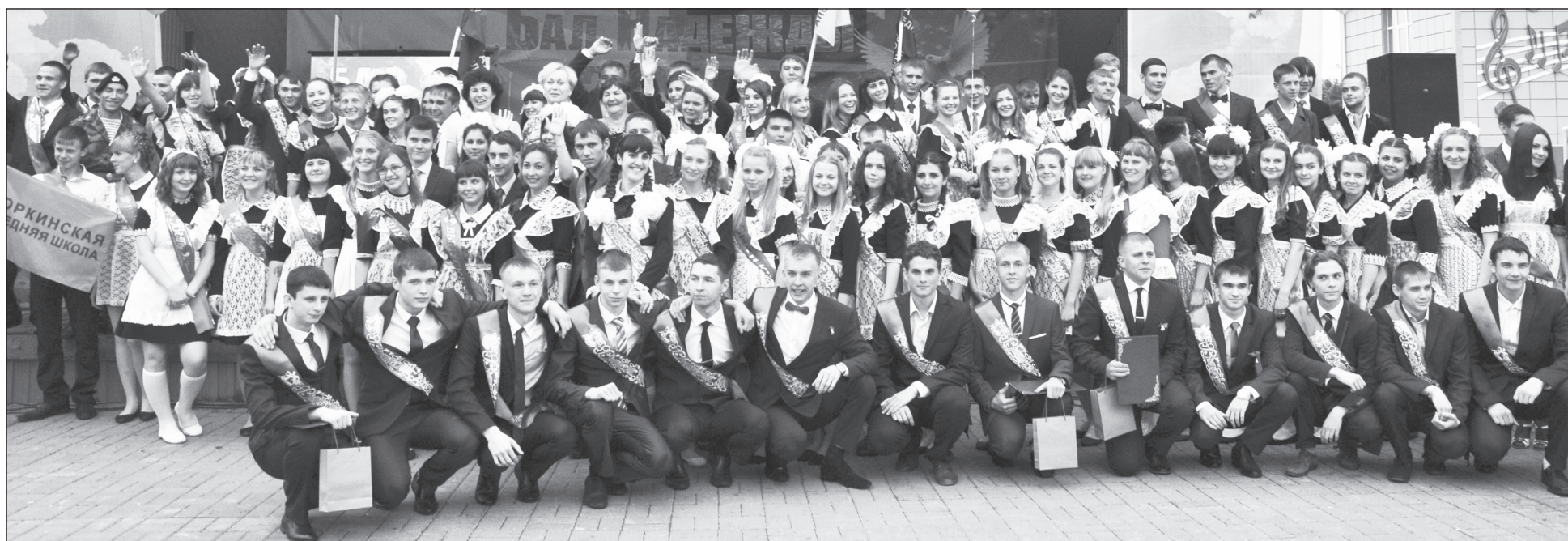
В 2016 году школы района дали путёвку в жизнь 129 выпускникам.

Школьные дни позади. Начался новый этап жизни, который принесёт много интересного. Пусть принятые решения будут правильными, а будущее — счастливым!