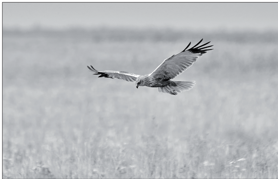
Лунь, парящий над лугами.