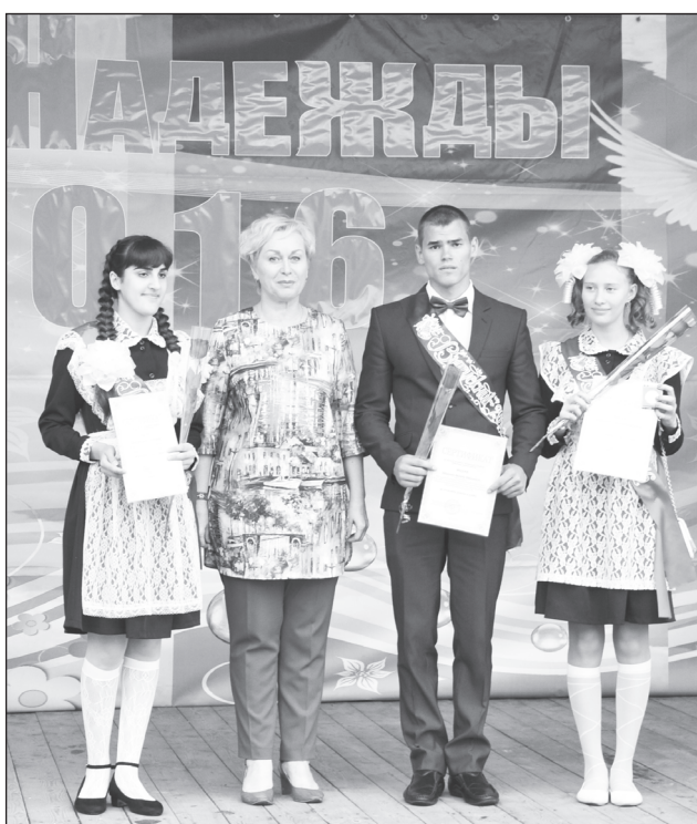
Медалисты — наша интеллектуальная элита.

Нашли своих героев и номинации «Молодёжный лидер» и «Спортивная надежда», «Талант и