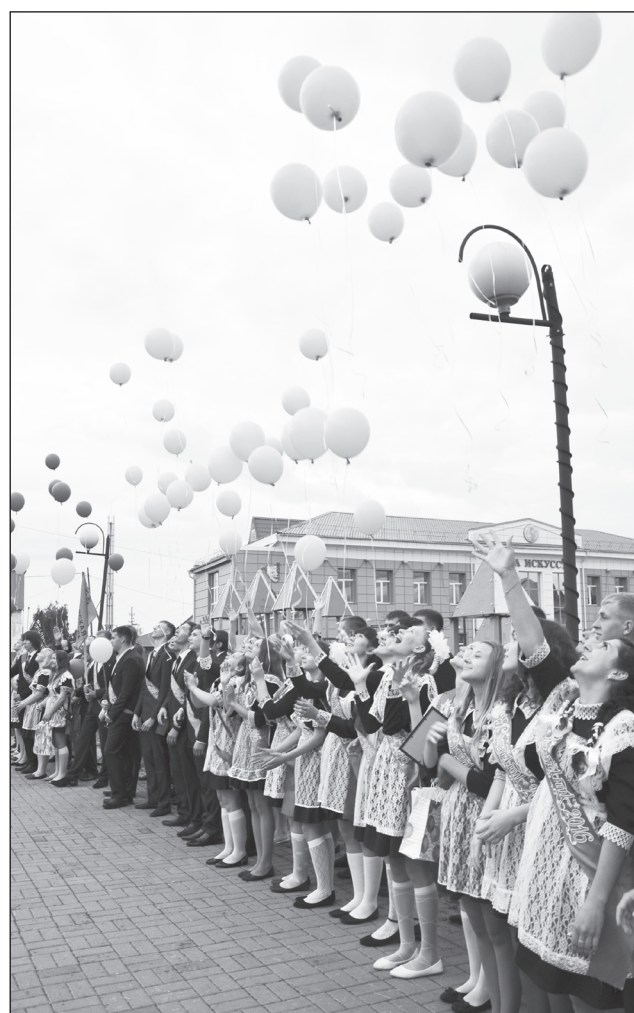
Мечту исполнит шар воздушный.

Эта тема возвращения звучала почти в каждом обращении взрослых к выпускникам. Ведь уже в прошлом времена, когда за лучшей долей нужно было обязательно ехать в город и год за годом покорять этот шумный муравейник. Сейчас многие осознают — лучше быть полезным агрономом и достойным жителем в родном селе, чем заштатным невостребованным юристом, коротающим жизнь в душном офисе. Возможно, детям, которые только расправляют крылья