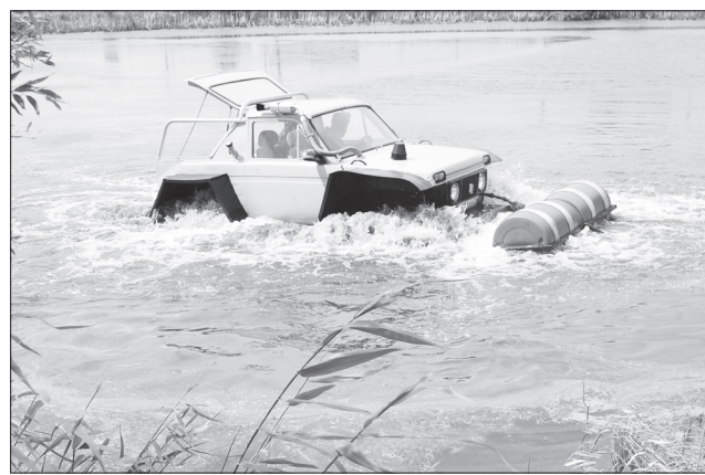
По воде, аки по суше.

следнему слову техники оборудовал, компьютерную диагностику теперь уже проводит, с любыми иномарками, как говорят, на ты. Месяцев шесть назад загорелся желанием изготовить свою машину. Да не простую, а чтобы по любому сибирскому бездорожью без труда проходила. Снегоболотоход, короче, свой решил сконструировать. Такой, чтобы и водные преграды спокойно преодолевал.