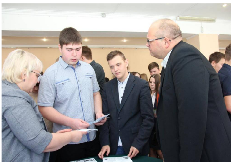
➤ Учащиеся с представителями пединститута г. Ишима.

Материал печатается на договорной основе