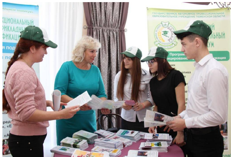
➤ Представители Ишимского многопрофильного техникума Викуловского отделения.