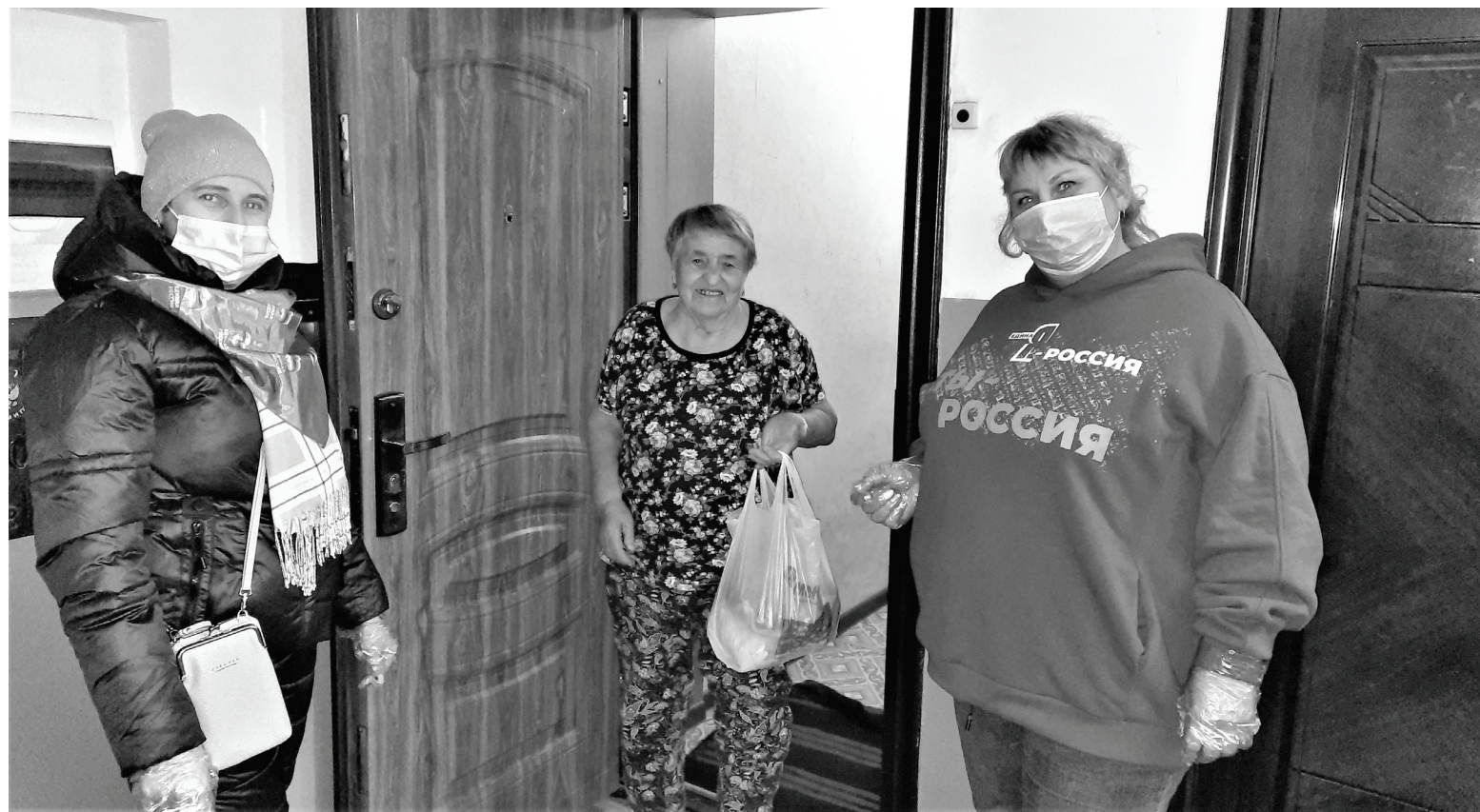
Добровольцы районного центра оказывают помощь землякам.