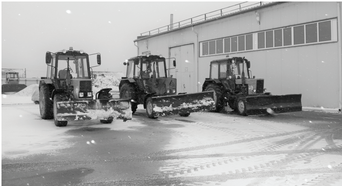
Техника ДРСУ-5 готова к зимнему сезону.

Специалисты ДРСУ-5 завершили строительные работы и вышли на расчистку заснеженных дорог