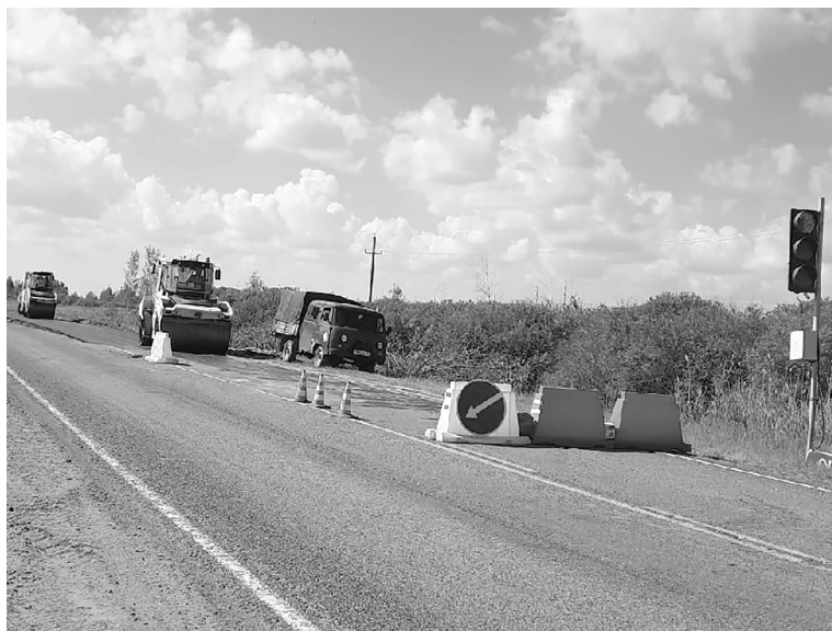
Специалисты дорожной службы выполнили поставленные задачи.

В целом отмечу, что все поставленные задачи на летний сезон 2021 года по ремонту автомобильных дорог в Сладковском районе Маслянским участком ДРСУ-5 АО «ТОДЭП» выполнены в полном объёме.