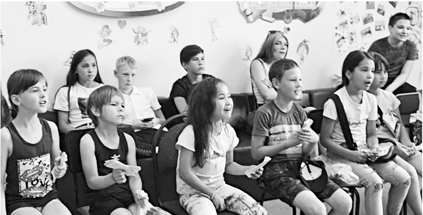
«Экономический аукцион» для детей в КЦСОН «Тавда».