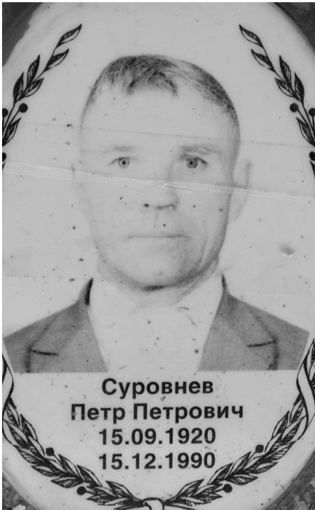
Фотография ветерана войны.