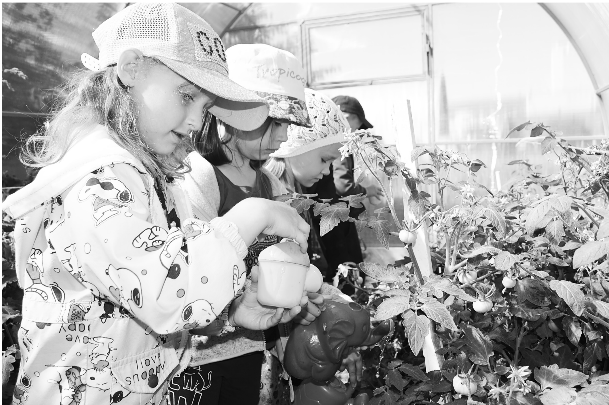
Воспитанники подготовительной группы первого корпуса понимают важность правильного ухода за растениями и с радостью помогают воспитателю с поливкой.

В Нижнетавдинском детском саду «Колосок» полным ходом идёт интересный исследовательский проект