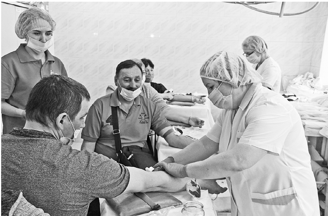
➤ День донора в Викулово

28 марта в поликлинике села Викулово доноры сдавали кровь. Два раза в год проходит акция, желающие всегда есть. Многие приходят на пункт сдачи крови уже много лет. В самом начале – кабинет профилактического осмотра, заполнение всех бланков и... очередь.