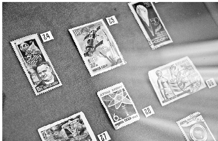
➤ На новой выставке в музее