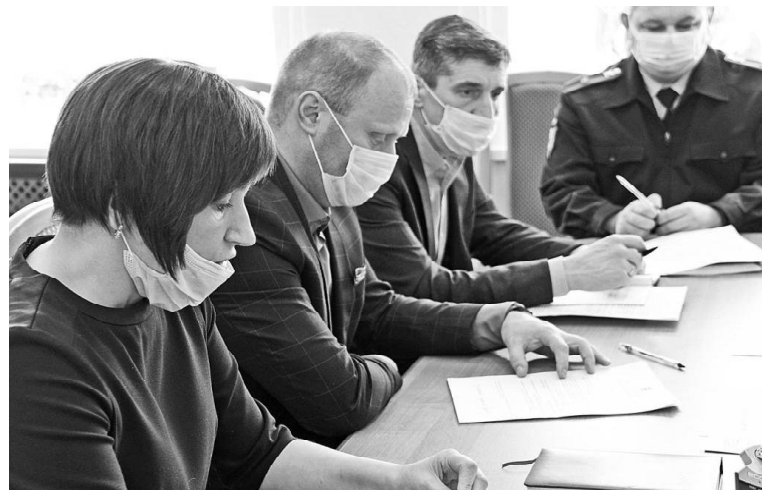
➤ Заседание Совета по противодействию коррупции

проведено в сельских поселениях района одно общественное обсуждение по внесению изменений в проект планировки. В аналогичном периоде прошлого года — четыре публичных слушания. Справки БК предоставили 71 муниципальный служащий, 9 руководителей муниципальных учреждений.