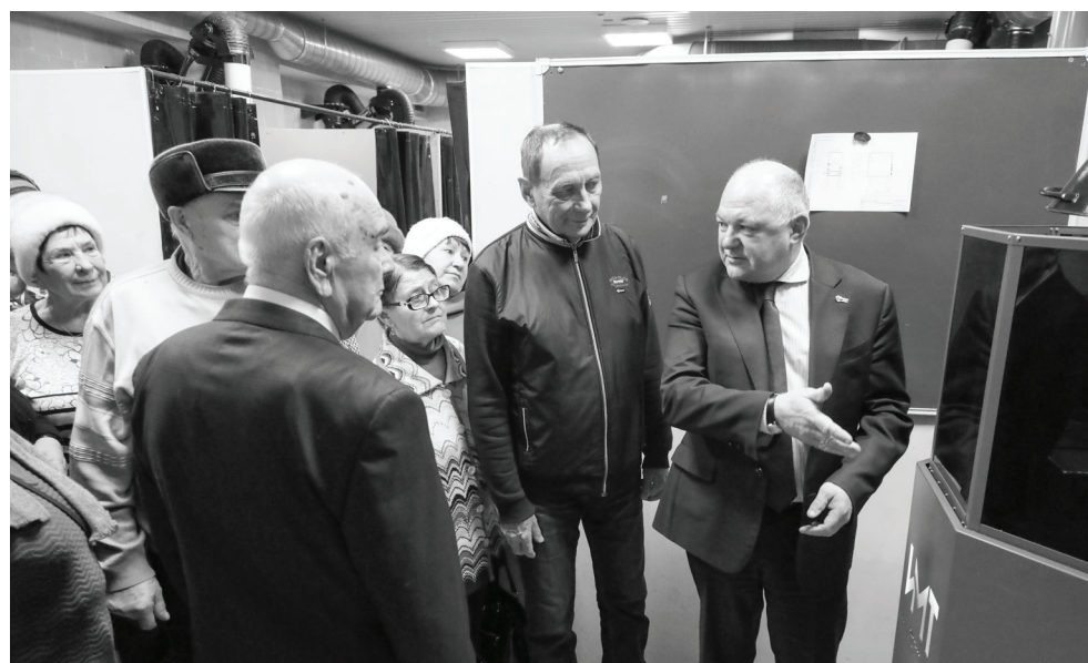
Студенты Ишимского многопрофильного техникума имеют возможность оттачивать профессиональные навыки на самом современном оборудовании. Ветераны остались впечатлены оснащением учебных лабораторий.

филиалы в Абатском, Викулово, Сорокино, Казанском. В техникуме обучается 2500 студентов, из них 1800 – в Ишиме. Поступают к нам абитуриенты как с базой 9 классов,