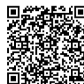
Смотрите фото на нашем сайте «Исетск72»

День Победы — это не только память о прошлом, но и напоминание о том, как важно быть вместе. И финальная песня концерта стала ярким тому подтверждением.