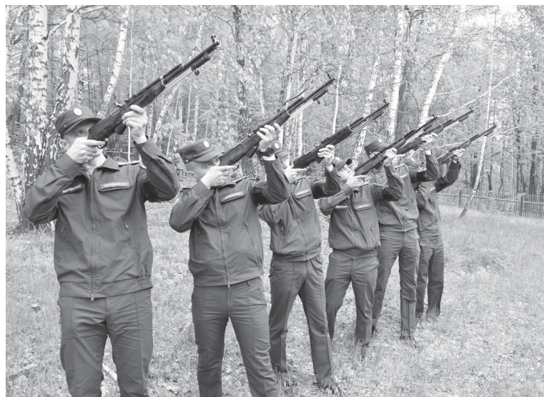
Воина-сорокинца похоронили на местном кладбище с воинскими почестями