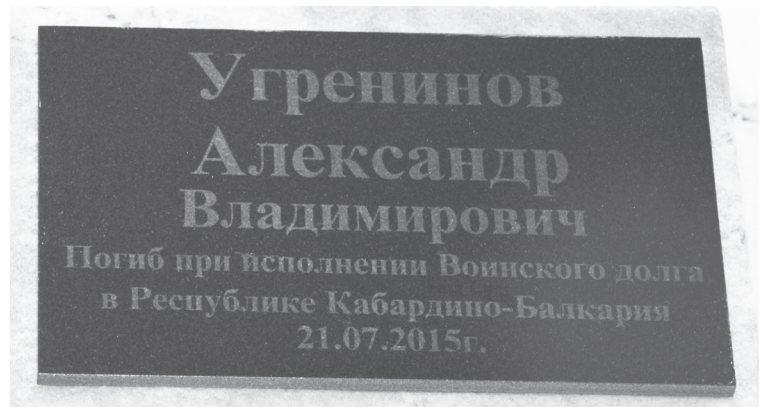
Одна из мемориальных плит, установленных на Проспекте Победы села Упорово.