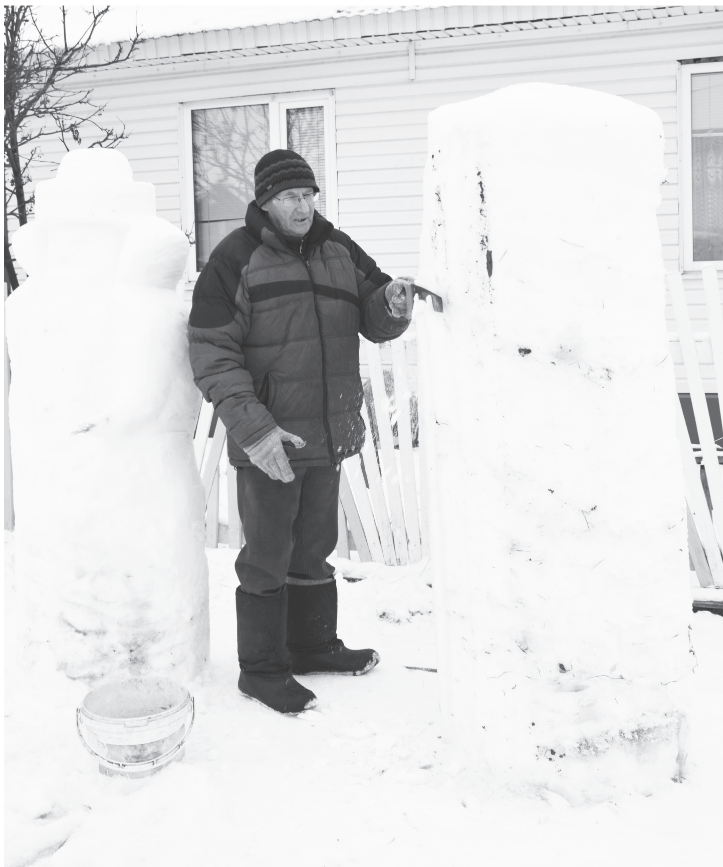
Работа над скульптурой Деда Мороза завершена, на очереди – Снегурочка.