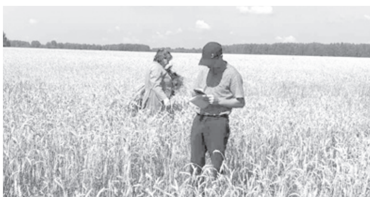
|| Фото из архива Россельхозцентра

апробации – 9500 гектаров, заявленные культуры – пшеница, ячмень, овёс и горох. На сегодняшний день мы побывали в восемнадцати хозяйствах, полностью проведена апробация гороха. Геолокацию каждого поля отмечаем в программе АгроСемЭксперт. Определяем планируемую урожайность, засорённость посевов, наличие пыльной головни, сортовой и зерновой примеси. В дальнейшем разбор снопа проходит в лабораторных условиях.