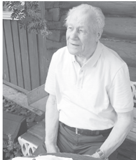
|| Фото Анны Шпановой

В 1987 году решением Совета министров СССР переведён в Государственный строительный комитет (Госстрой СССР) на должность начальника управления