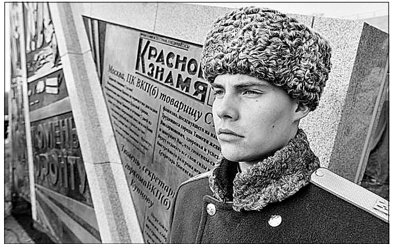
Газетный лист «Красного знамени» за 1943 год высечен в камне на мемориале «Тюмень – город трудовой доблести».